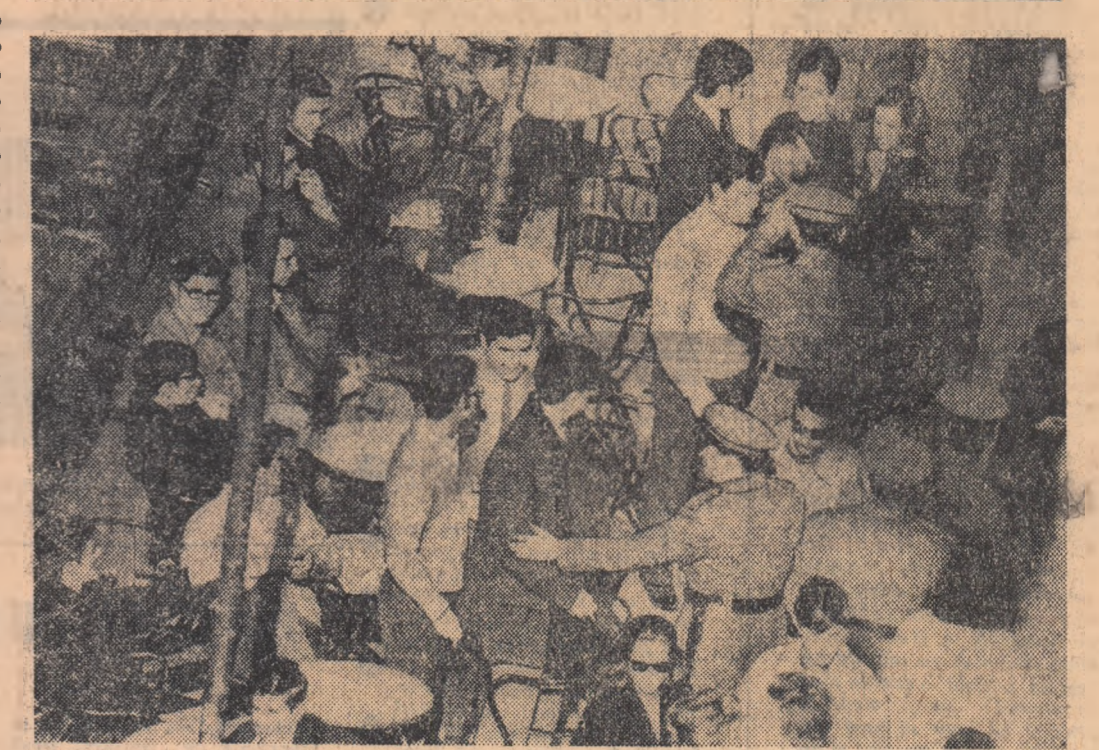
Politia în acțiune împotriva studenților în centrul Madridului.