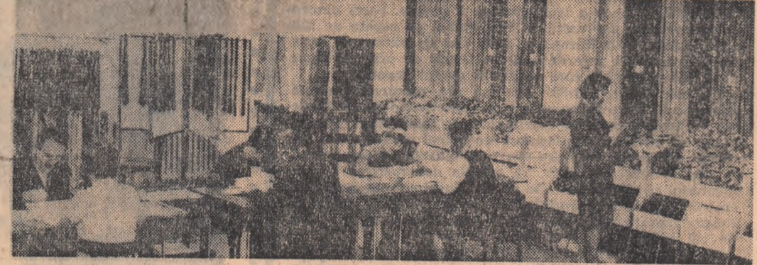
Un colț al expoziției permanente (textile-încălziminte) înființată de Întreprinderea comercială cu ridicata din Cluj

Teatrul Național „I. L. Caragiale”, sala Comedia: ROMEO ȘI JULIETA (ora 19,30); sala Studio: JOCOL ADEVĂRULUI (ora 19,30). Opera Română: FRUMOSA DIN PĂDUREA ADORMITA (ora 19,30). Teatrul de Stat de Operă și Simfonie: SECRETUL LUI MARCO POLO (ora 19,30). Teatrul de Comedie: OPINIA PUBLICĂ (ora 20). Teatrul „Lucia Sturdza Bulardea” sala din b-dul Șchiuțu Măgureanu: D-ALE CARNAVALULUI (ora 20); sala Studio: KEAN (ora 20). Teatrul Mic: AMINTIREA A DOUĂ DIMINETI DE LUNI (ora 20). Teatrul „C. I. Nottara”, sala din b-dul Magheru: LUNA DEZMOSTENITILOR (ora 19,30); sala Studio: CIND LUNA E ALBAȘTRA (ora 20). Teatrul „Barbu Dăbuleț” sala din b-dul Șchiuțu Măgureanu: BOTOȘI (ora 19,30). Teatrul Evreiesc de Stat: IVANOV (ora 20). Teatrul „I. Creangă”: LUCEAFĂRUL DINSPRE ZIU (ora 9,30). Teatrul „Tănărașcu”: ILEANA SINZIANA (ora 17).