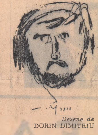
Desene de DORIN DIMITRIU