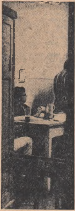
Indiscreția obiectivului (Intr-un câmin studențesc, în timpul sesiunii)