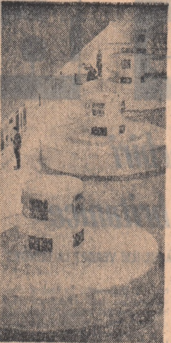
Sala turbinelor Hidrocentralei „Gh. Gheorghiu-Dej” de pe Argeș