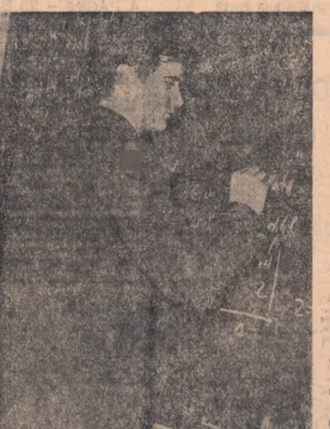
— Am început să spun tot...