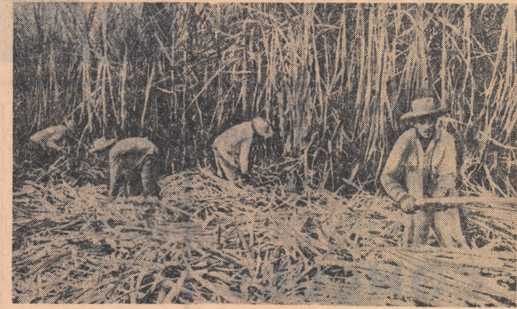
REPUBLICA CUBA: Se recoltează trestia de zahăr.

GUVERNUL Coreei de sud a avertizat luni că va expune pe corespondenții presei japoneze dacă aceștia vor continua să furnizeze informații în care lasă să se înțeleagă că în Coreea de sud există o „mişcare de eliberare națională”, transmite corespondentul din Seul al agenției japoneze de presă „Jiji Press”.