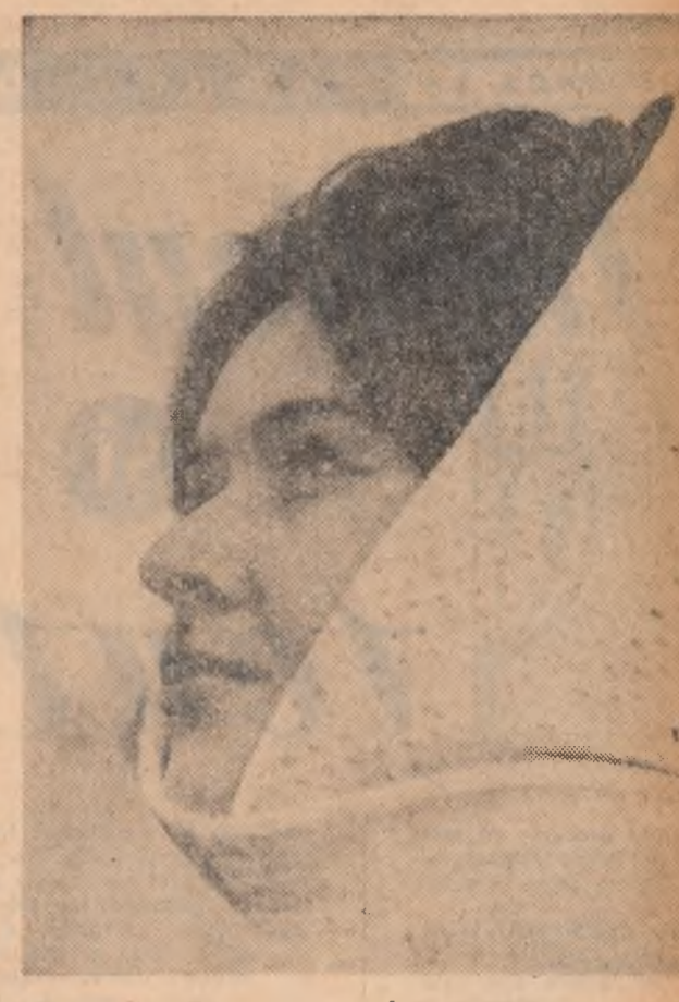
Frumuseţea nu trebuie argumentată

ORGAN CENTRAL AL UNIUNII TINERETULUI COMUNIST