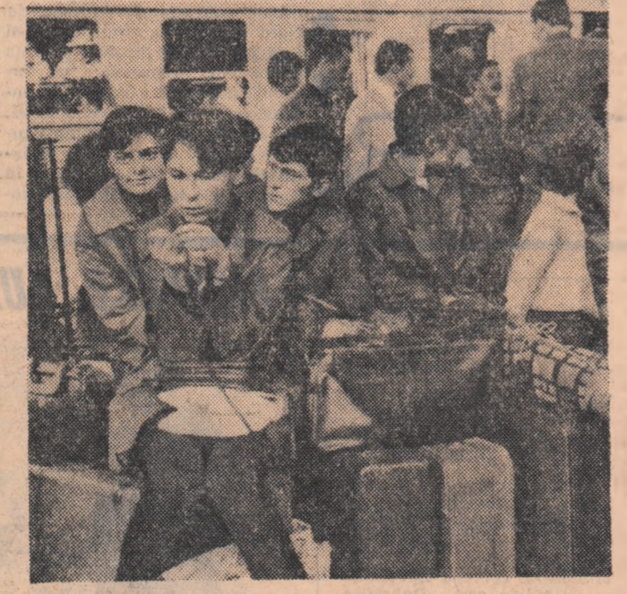
In aşteptare...

A fi abonant acum la biblioteca satului, a trece mereu la librărie, înseamnă în toate comunele ţării o obişnuinţă. Aceasta este un fenomen care spune totul.