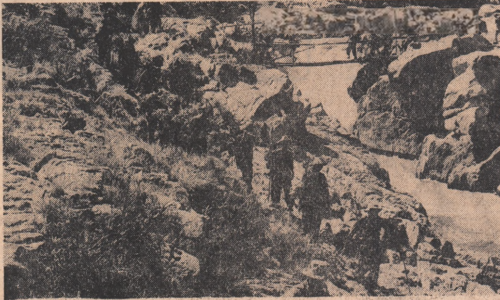
Patrioți sud-vietnamezi în misiune de luptă