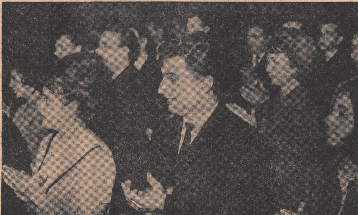
Aspect din sală.

În cursul după-amiezii de ieri a avut loc plenara comună a C.C. al U.T.C. și Consiliului U.A.S.R., care a adoptat unele derogări de la Statutul U.T.C. în legătură cu simplificările ce se impun în structura organizatorică în spiritul Hotărîrii Plenarei C.C. al P.C.R. din 29 noiembrie — 1 decembrie 1967.