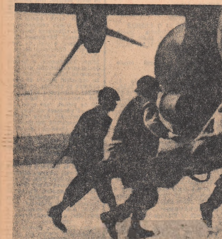
Sub tirul artileriei forțelor patriotice, militari americani transportă rănii la aeroportul bazei Khe Sanh, încercuțată.

Rămășițele rachetei au fost adunate și expediate la Stockholm unde au intrat spre cercetare în laboratoarele armatei. În dimineața în care lăzile cu părțile recuperate ale lui „V-2” erau încă în drum spre Stockholm, pe