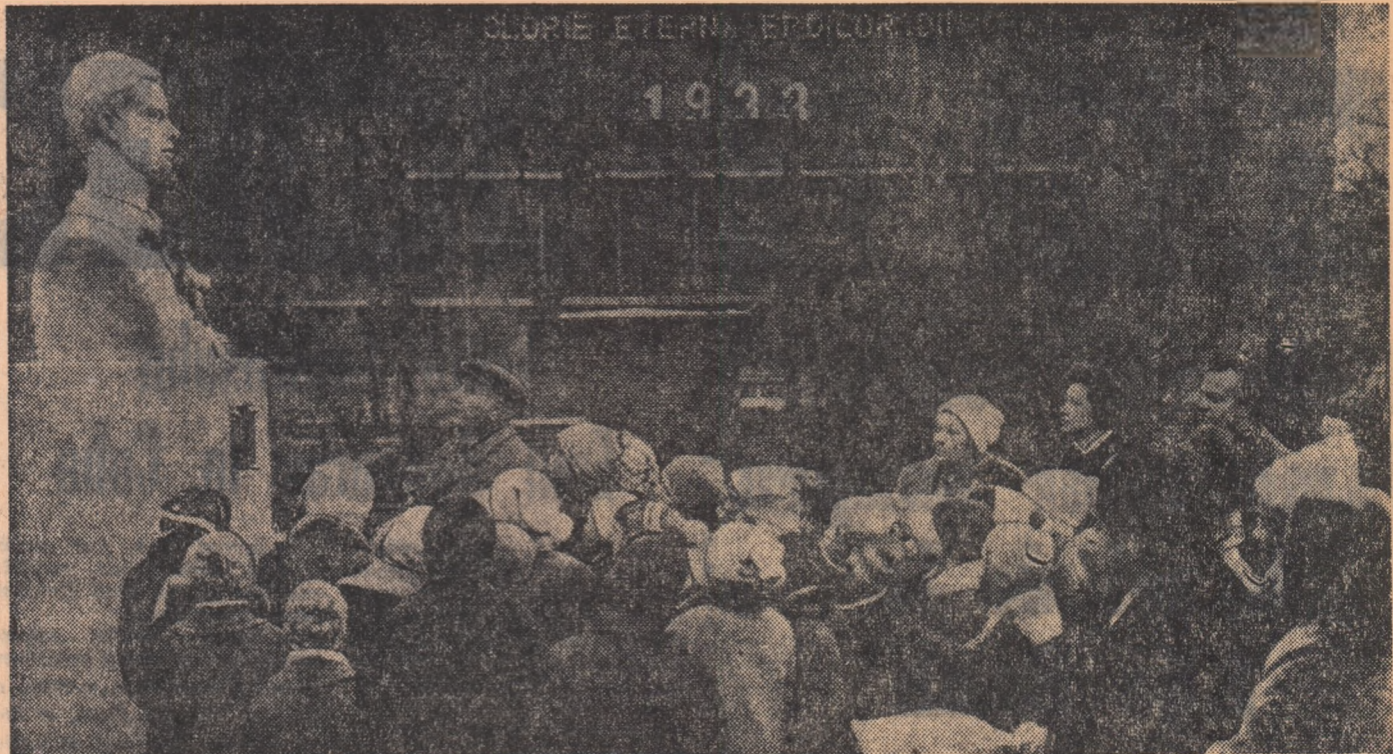
Elevii clasei II-a de la școala nr. 194 din Capitală participă la o emoționantă lecție de istorie asupra evenimentelor din 16 februarie 1933. Profesor: unul din participanții la luptele de acum 35 de ani.

Cîndva uzina fusese lovită de moarte. Trăise ceasuri grele. Se ridicase apoi din propriile ei ruine, renăscuse din însăși singele ei, adunînd în pieptul grîntărilor