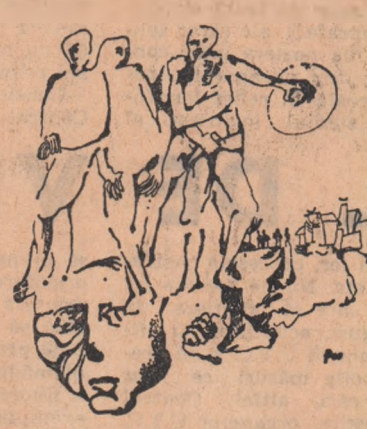
Deznă de DORIN DIMITRIU

— Ce vom purta în sezonul cald? — Ca noutate, încălzimîntele din lac colorat și sortimentul tip moacă din piel verurate. În materie de modă, (Continuare în pag. a III-a)