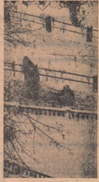
Grafiică de iarnă