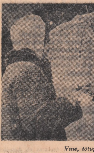
Vine, totuși, primăvara!