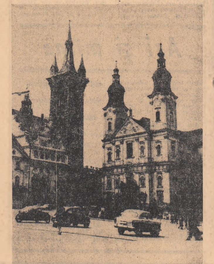
R. S. CEHOSLOVACA. „Turnul negru” din Klatov, orașul din vestul Boemiei.

● 4 milioane de narcomani ● Cîini de rasă și buline cu heroină ● Colectul din avionul special al președintelui