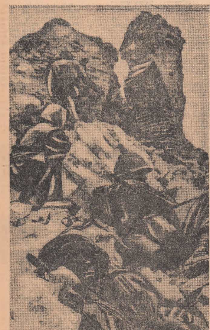
VIETNAMUL DE SUD. Militari americani în derută, în urma atacurilor întreprinse de patrioții la Hue.

În Delta Mekong detașamentele ale F.N.E. au continuat să bombardeze diferite instalații militare americane și sud-vietnameze între care aerodromul de la Tra Noc. La sud-est de My Tho, între un detașament al forțelor patriotice și trupe guvernamentale s-a produs o ciocnire soldată cu numeroși morți și răniți în rândurile militarilor saigonezi. Agenția France Presse, citind surse oficiale sud-vietnameze relatează că în noaptea de joi spre vineri patrioții au deschis foc de mortiere asupra stației radar de la Phu Lam și asupra cartierului administrativ al orașului Binh Chanh.