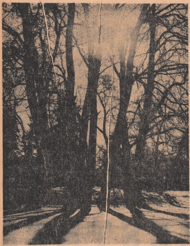
Mestecenii își scutură haina hibernală.