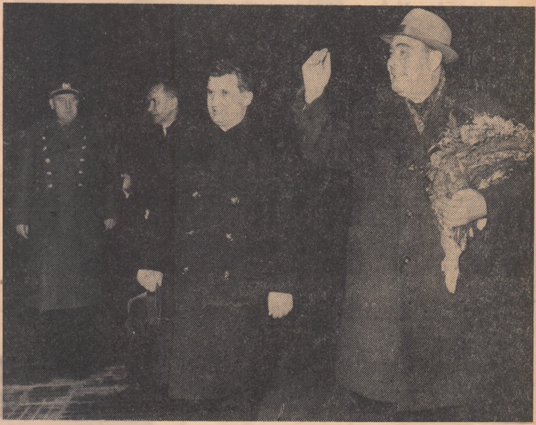
Marti seara, in drum spre Sofia, a sosit in Bucuresti delegatia Uniunii Sovietice...