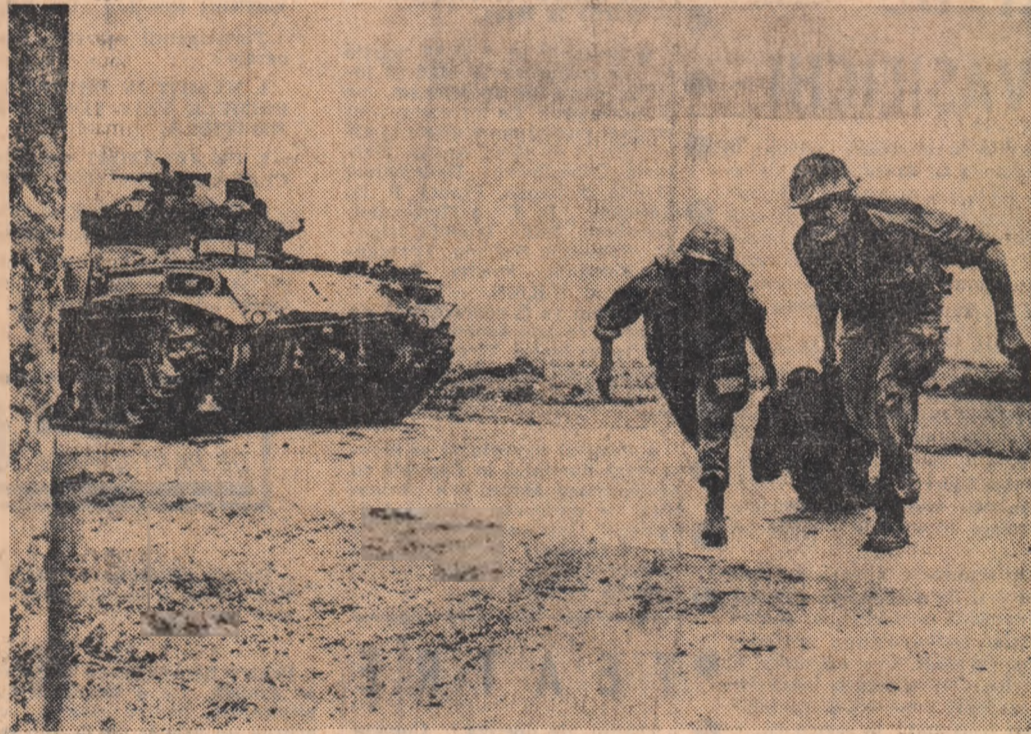
VIETNAMUL DE SUD. Evacuarea militarilor americani răniți în cursul luptelor