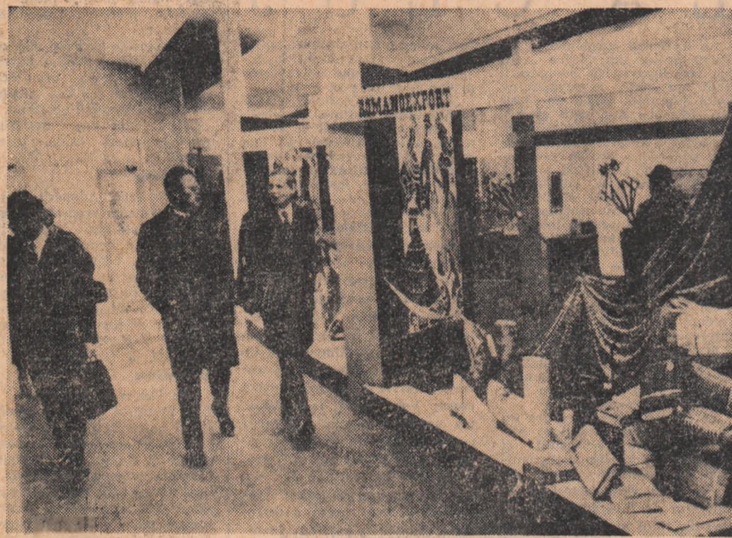
R. F. a GERMANIEI. Pavilionul românesc la Tîrgul internațional de la Frankfurt

La recepție au participat șefii unor misiuni diplomatice, membri ai corpului diplomatic, ziariști bulgari și străini. Recepția s-a desfășurat într-o atmosferă cordială, tovarășească.