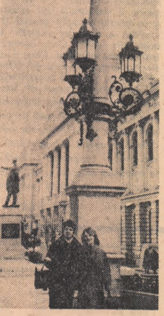
Prin fața Universității „Al. I. Cuza“ din Iași

Un an efectiv practicat în afara meseriei. Economistul stagiar este deci obligat să execute lucrări care n-ău aproape nimic comun cu pregătirea sa.