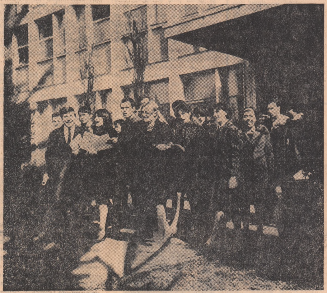
In sfîrșit, după capricioase întîzieri, primăvara ne omorează totuși cu semnele de prezență. Era de altfel obligată să răspundă la apel; i-o împunea mai cu seamă catalogul școlar care consemnează, începînd de azi, soseala Vacanței de primăvară. Titlatura obligă!