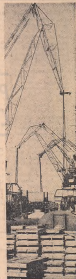
Activitate intensă în portul Constanța

conducători ai unor instituții centrale și obștești, redactori șefi ai ziarelor centrale și alți activiști de partid și de stat. În încheierea consfătuirii a luat cuvîntul tovarășul Nicolae Ceaușescu, secretar general al C.C. al P.C.R.