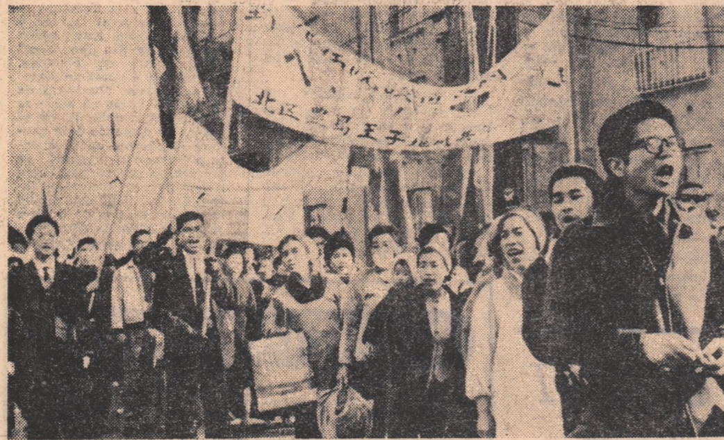
JAPONIA. ÎN timpul unei demonstrații împotriva prezenței trupelor americane pe teritoriul japonez