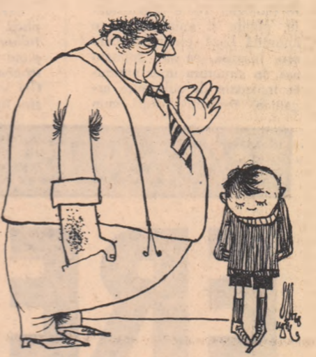
— Mă vezi pe mine cățărindu-mă în pomi, jușind pe strădă, bătînd toată ziua mingea, coborînd pe balustrada scării??? Desen de N. CLAUDIU