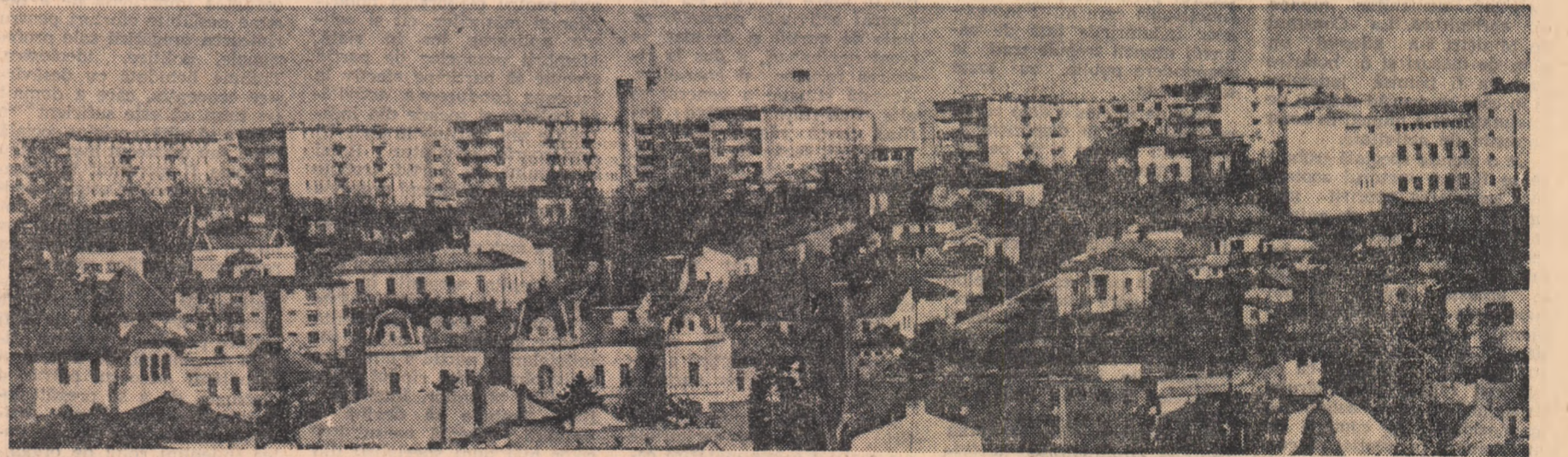
O imagine parțială de astăzi a orașului Slatina — capitală de județ

Să fie oare Oltul nașul care în anul acesta '68, și-a rebotezat finul? Parcă îi auz glasul de apă: Te vei numi ca la începuturi.