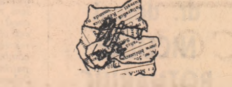
— Ce oameni d-le? De trei ore am aruncat hirtia asta și nimeni nu se simte s-o ridice.