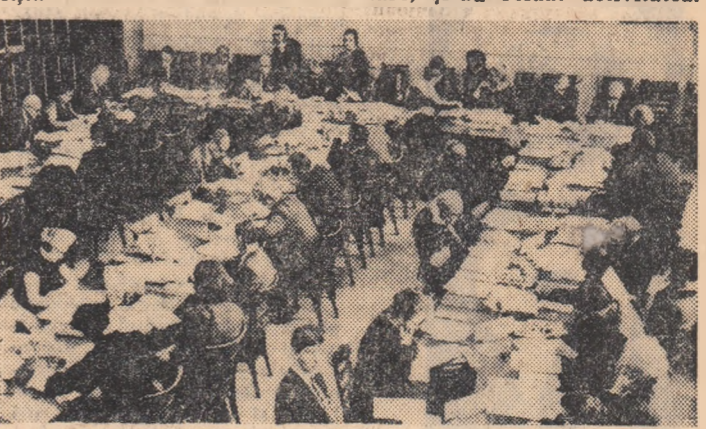
GENEVA. ÎN timpul unei ședințe a Comisiei O.N.U. pentru drepturile omului

Agenția France Presse transmite că forțele iordanice au recupat întreaga zonă care a fost joi teatrul luptelor, iar posturile de supraveghere și control de-a lungul liniei de încetare a focului au fost reînstate. De asemenea, aerodromul din Amman a fost redeschis circulației normale. Școlile și instituțiile din învățămînt, care fuseseră închise în timpul operațiunilor militare, și-au reluat activitatea.