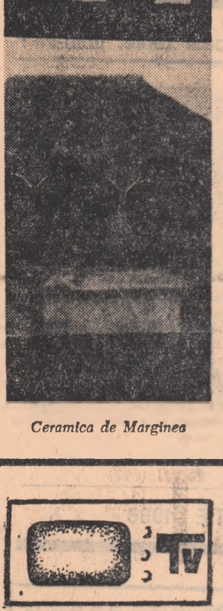
26 martie 1968