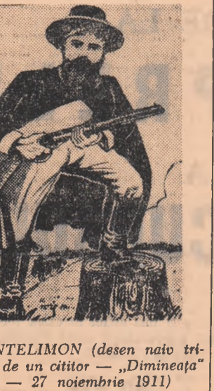
PANTELIMON (desen nativ trimis de un cititor — „Dimineața” — 27 noiembrie 1911)