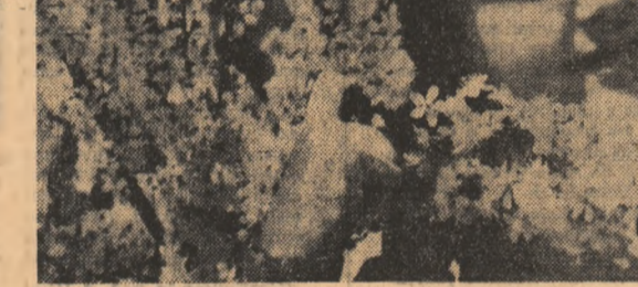
Așa arată, oare, primăvara?