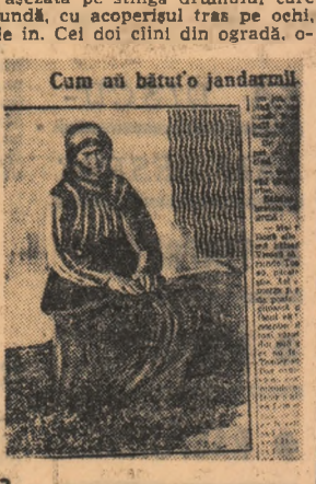
Cum au bătut o jandarm

În prîncipia „Cosminului, fiul de zimbru” — incheiat rapid după al treilea episod, ca un boxeur amator care nu poate ține mai mult de trei reprize — se pare că Pălfîm, confrătat de la „Cazeta literară”, a avut dreptate să-l privească rece și rezecat de la bun început. Noi, după primul episod, am bănut prea încredințori din palma, afirmînd speranța că vom avea un serial care-și va face datoria onorabilă de serial. N-a fost să fie așa și luăm păcatul optimismului asupra noastră.