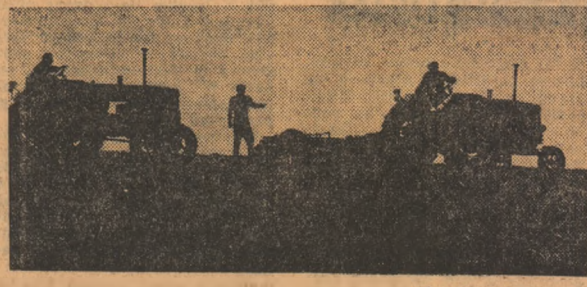
Județul Cluj. Se lucrează la semănatul sfeclii de zahăr