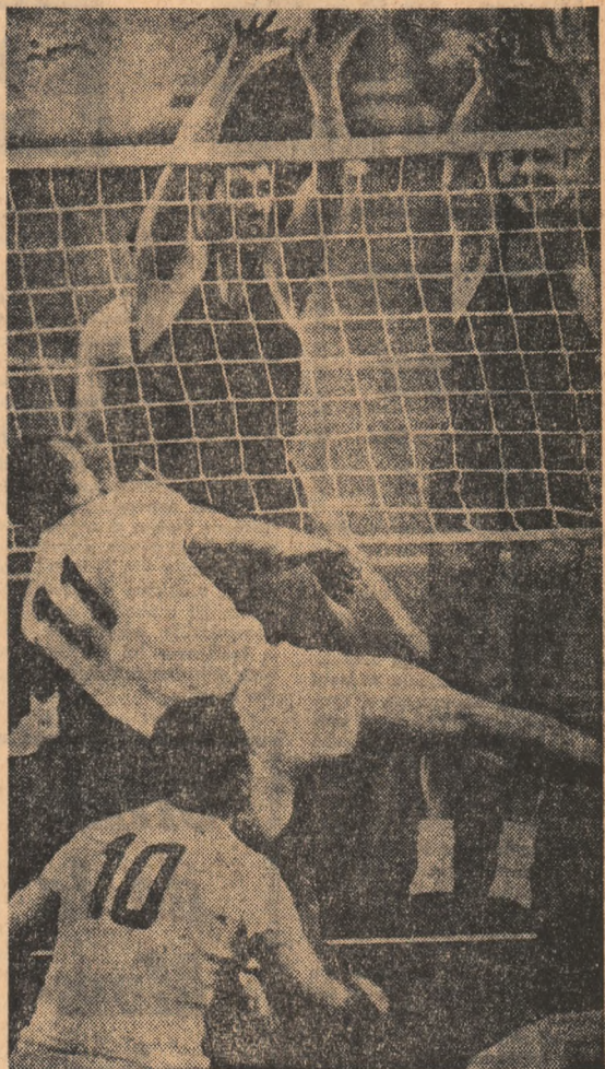
Simbătă seara voleibalistii de la Steaua au îmbrăcat tricourile de campioni. Disputat într-o nouă formulă prin însumarea punctelor acumulate în campionat cu cele realizate în cadrul celor trei partide finale — turneul care a reunit cele mai valoroase patru echipe masculine românești de volei nu s-a ridicat, prin înținuta tehnică și spectaculozitate, la nivelul așteptat. Steaua a plecat din start cu atuu celor 20 de puncte acumulate în campionat și cu recenta răsturnare de scor din meciul cu Dinamo. Principala contracandidată, echipa Dinamo, nu s-a putut, de la început, o resemnă aspiranță la titlul de „vicecampioni”. Rapid n-a fost jeltor ceea ce ne obișnuia, adică o echipă cu o redutabilă forță de joc în timp ce formația studenților gălățeni, Politehnica, ne-a amintit, doar prin nume, de înfrângerea cu care-i urmăream rezultatele bune din Franța. Altă echipă atunci, alta acum... Dar gincolo de această lipsă de „sare și piper” a turmentat final, meritul campionilor este incontestabil. Avem convingerea că în competiția europeană a campionatelor la volei Steaua va fi o mesagerie pe măsura prestigului de care se bucură voleiul românesc.