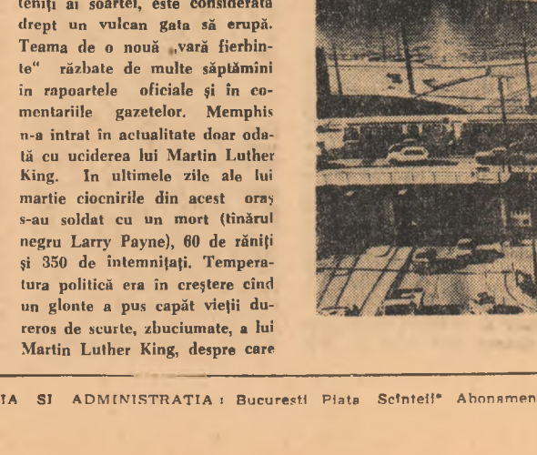
SUEDIA. Imagine din Stockholm.

Începînd de luni noapte, marile oraș Rio de Janeiro a trecut