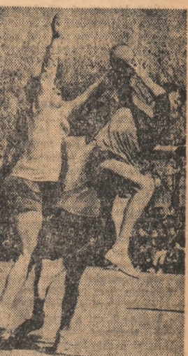
...clouă a campion... de handbal, inaugurată sârbătorit pe terenul de la „Tineretului” a prilejuit reluarea unei frumoase tradiții sportive: „U” București-„U” Cluj.