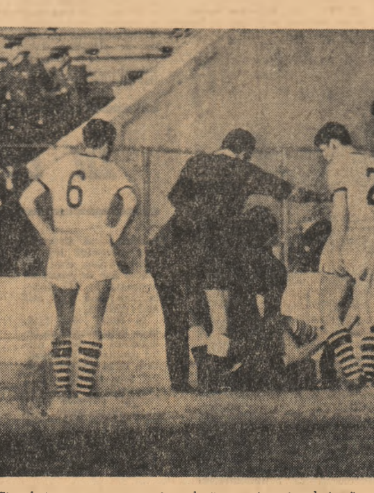
Cîteodată asemenea scene sint adecărate... Atunci trebuie să ne revoltăm. Cînd sint simulate, trebuie să ne intristeze.