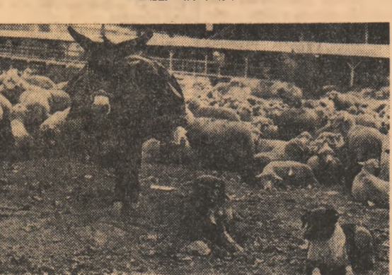
Doi dulzi și... dumnezii.