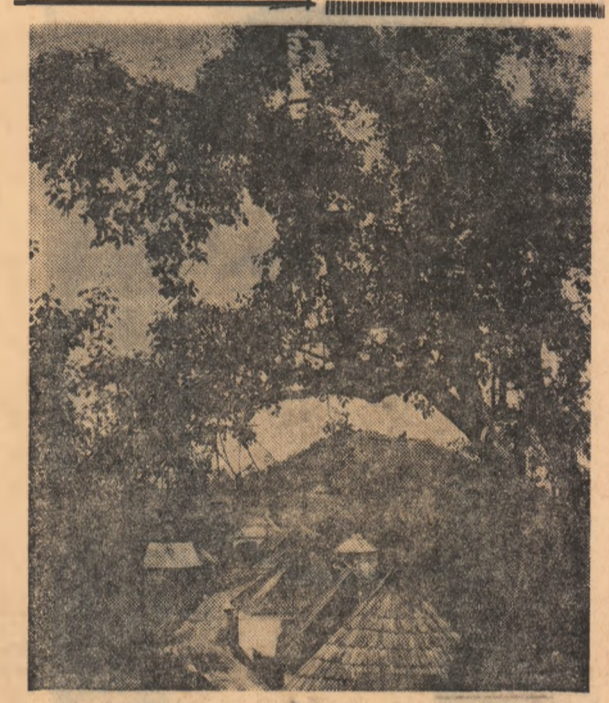
Frumuseșile patriei invită la drumeție