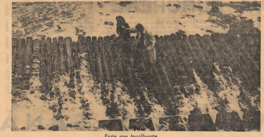
...Peste apa incolburate

(Urmare din pag. a 1-a) duceți. Se știe că în anul IV, pentru seminarul secolul, cadrele didactice recomandă, în listele bibliografice, și lucrări publicate în alte țări. Dar mulți studenți renunță să le consulte, neputînd depăși dificultățile de documentare în alte limbi. Studenții din anul V, care pregătesc acum lucrările de diplomă s-au văzut, nu o dată, nevoiți să apeleze la serviciile unor prieteni sau cunoștinși — pentru a obține textele, traduse în limba română, ale publicațiilor străine ce le-au fost recomandate de către cadrele de specialitate... Studiul limbilor străine în facultate se desfășoară pe parcursul a trei ani. Dacă în primul an, accentul se pune pe gramatica limbii, în anul II scopul este însușirea de către studenți a limbajului de specialitate, Programul anului III este mai pretentios — acum s-a precede îmbogățirea noțiunilor de specialitate fixarea cunoștințelor. Avînd în vedere erorile rîndite programe de învățămînt și notele mari obținute de studenți, dificultățile întîmpinate în acest, în parcurgerea bibliografiei în limbi străine, par nefiresci. Și totuși... Învățarea modernă a unei limbi străine presupune existența unor laboratoare de audioaparatură acustică și filme speciale pentru experimentarea metodelor „audio-vizuale” adecvate nivelului universitar, apar-