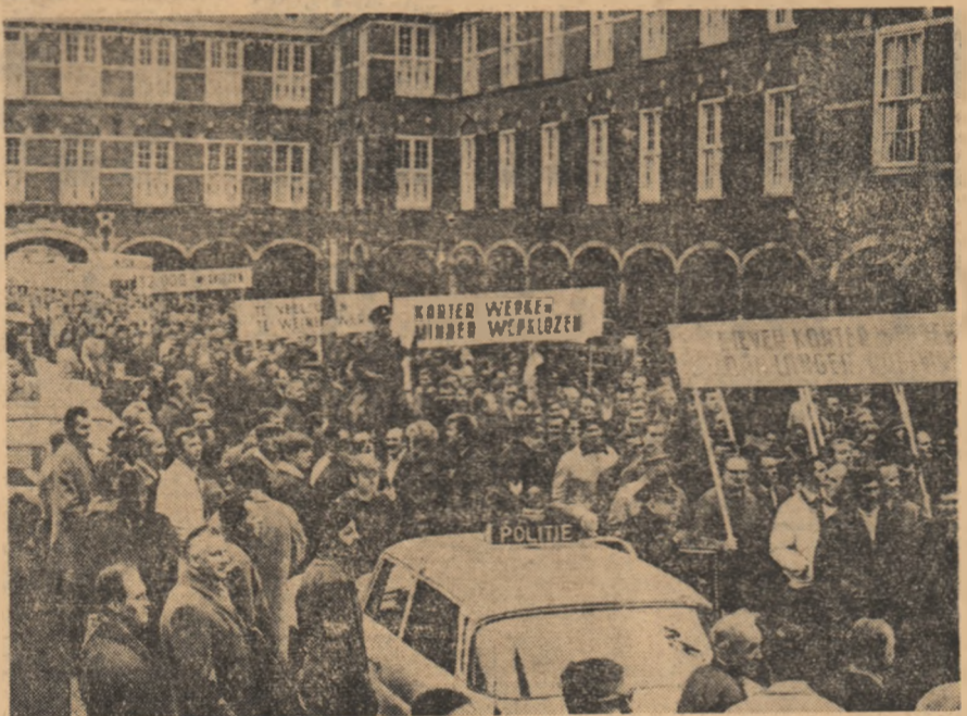
Aspecte de la o demonstrație revendicativă a muncitorilor din construcții din capitala Olandei

La plecare, premierul român a mulțumit pentru ospitalitate, explicațiile primite, pentru darul oferit de gazde Bibliotecii de stat din București — un exemplar în facsimil al Codexului Argenteus.