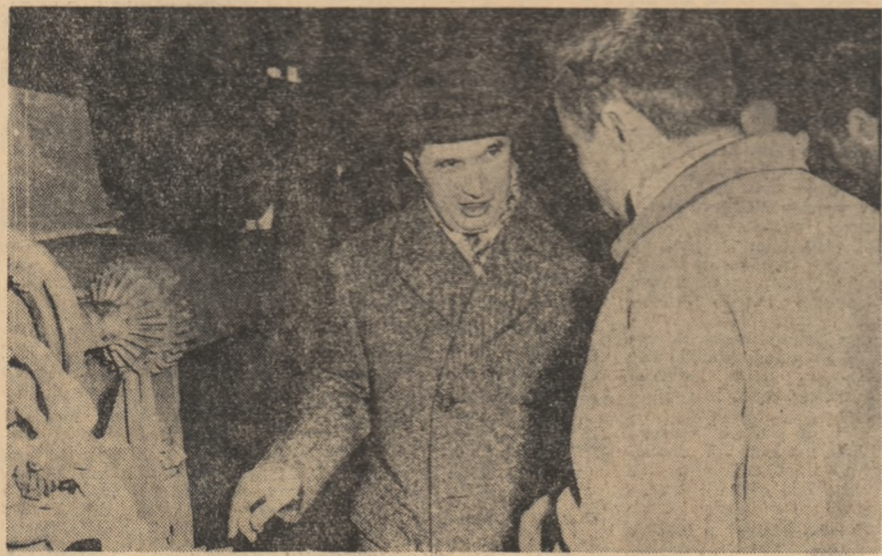
În vizită la întreprinderea mecanică de utilaje Medgidia

Acum, în aprilie, peisajul dobrogean apare surprinzător de nou, de proaspăt. Gîmpuri de un verde intens, livezi înflorite, ogoare neșirșite cu brazde de curînd întoarse de plugul tractoarelor. În depărtare se zăresc zidurile unei gări impunătoare, și în jurul ei, asemeni unui imens buchet multicolor, oameni — nenumărați oameni.