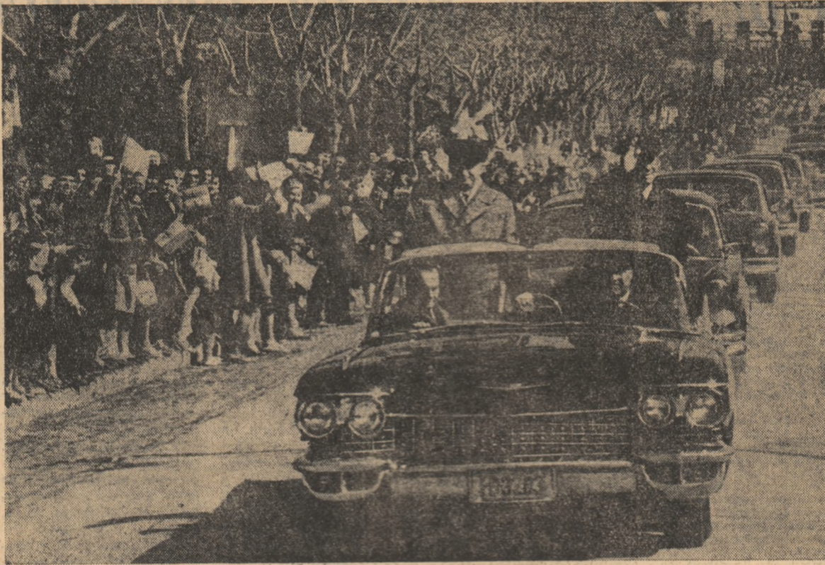
De-a lungul traseului, conducătorii de partid și de stat sînt întâmpinați cu căldură