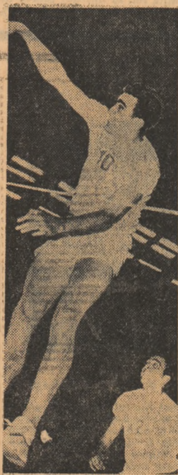
Aseară, la volei, Dinamo — Legia Varșovia 3-0 în primul meci din semifinalele C.C.E. (Amănunte în pag. a III-a)

În anii premergători revoluției din 1848, în biroul acela),