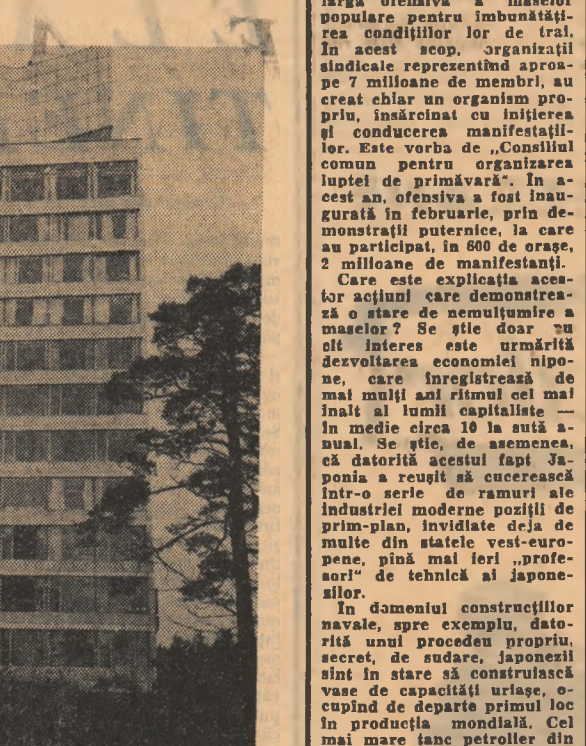
FINLANDA. Imagine din Helsinki

În Japonia a devenit o tradiție ca, în primele luni ale primăverii, să aibă loc o largă ofensivă a maselor populare pentru îmbunătățirea condițiilor lor de trai. În acest scop, se organizează demonstrații reprezentând aproape 7 milioane de membri, au creat chiar un organism propriu, însărcinat cu inițierea și conducerea manifestațiilor. Este vorba de „Consiliul comun pentru organizarea luptei de primăvară”. În acest an, ofensiva a fost inaugurată în februarie, prin demonstrații puternice, la care au participat, în 600 de orașe, 2 milioane de manifestații. Care este explicația acestor acțiuni care demonstrează o stare de nemulțumire a marelui public? Se știe doar un lucru interesant: că în Japonia se dezvoltă economia niponă, care înregistrează de mai mult timp ritmul cel mai înalt al lumii capitaliste — în medie circa 10 la sută anual. Se știe, de asemenea, că datorită acestui fapt Japonia a reușit să cucerească în ultimii ani de ramuri ale industriei moderne poziții de prim-plan, învidiate deja de multe din statele vest-europene, până mai ieri „profesori” de tehnică ai japonezilor.