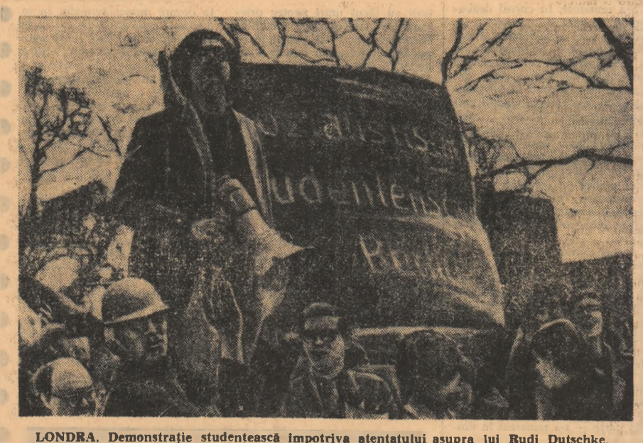
LONDRA. Demonstrație studențească împotriva atentatului asupra lui Rudi Dutschke.