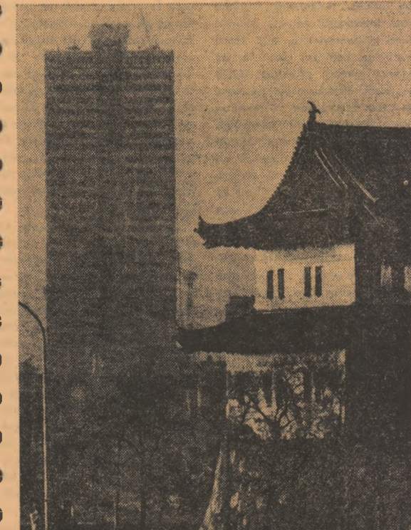
Tradițional și modern în peisajul urbanistic al capitalei japoneze — Tokio

Cererile de ajutor militar cu care a sosit Pak Cijan Hi la Honolulu au fost dezvoltate anticipat în cele mai mici amănunte: mai multe avioane ca rezerve moderne tip F-4C, instalații radar, o cantitate foarte mare de muniții pentru „armata de rezervă” sud-coreeană care numără 250 000 de oameni. El a mai cerut vase rapide cu care să „supravegheze” țărîmurile R.P.D. Coreene.