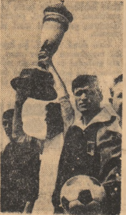
Moment emoționant! Căpitanul Selecționatelor liceelor bucureștene și frumoasa cupă acordată câștigătorilor.