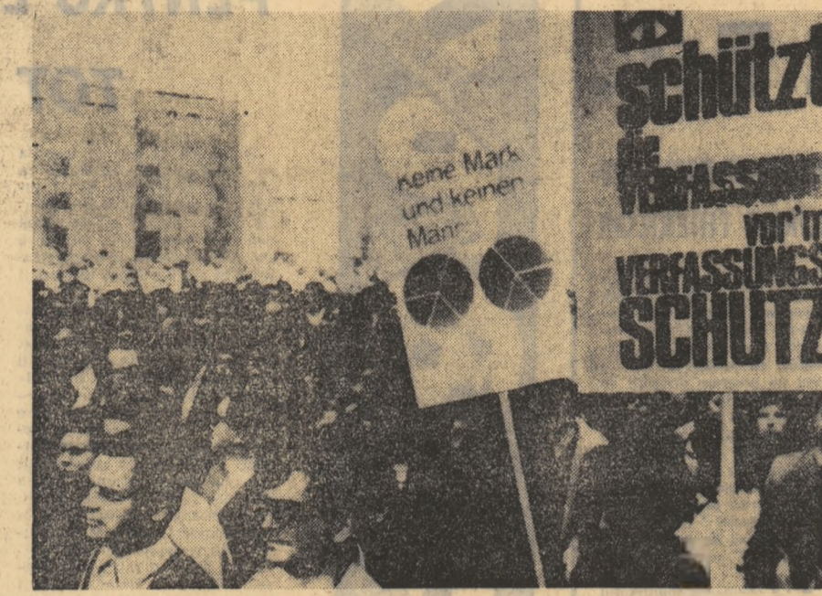
Aspect din timpul unei demonstrații a studenților din Berlinul Occidental în sprijinul revendicărilor lor.