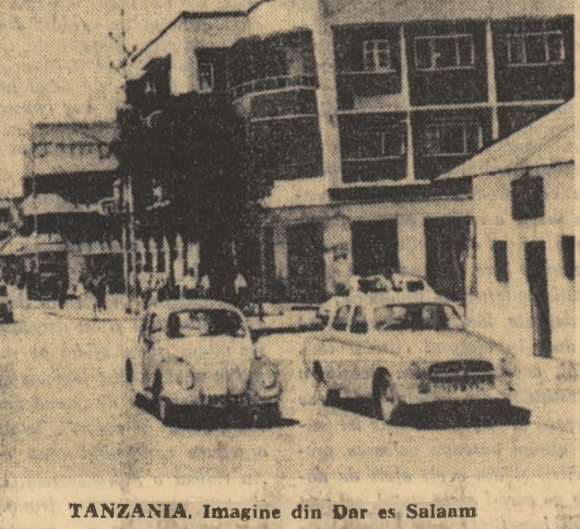
TANZANIA. Imagine din Dar es Salaam