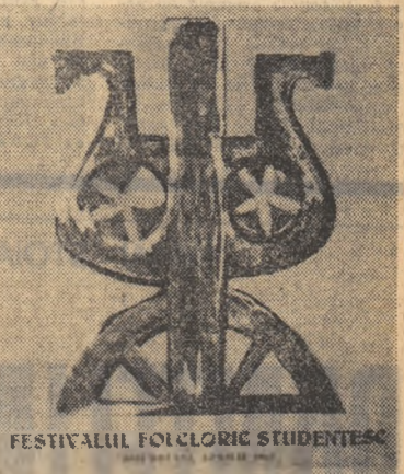
FESTIVALUL FOLCLORIC STUDENTESC