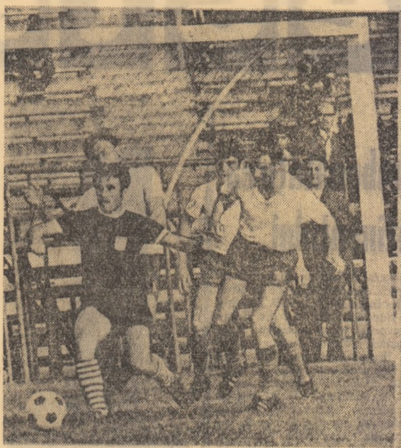
Păzit cu strășnicie Ionescu nu s-a putut descurca de data aceasta

Drum bun, și vom fi lingă voi cu toată dragostea.