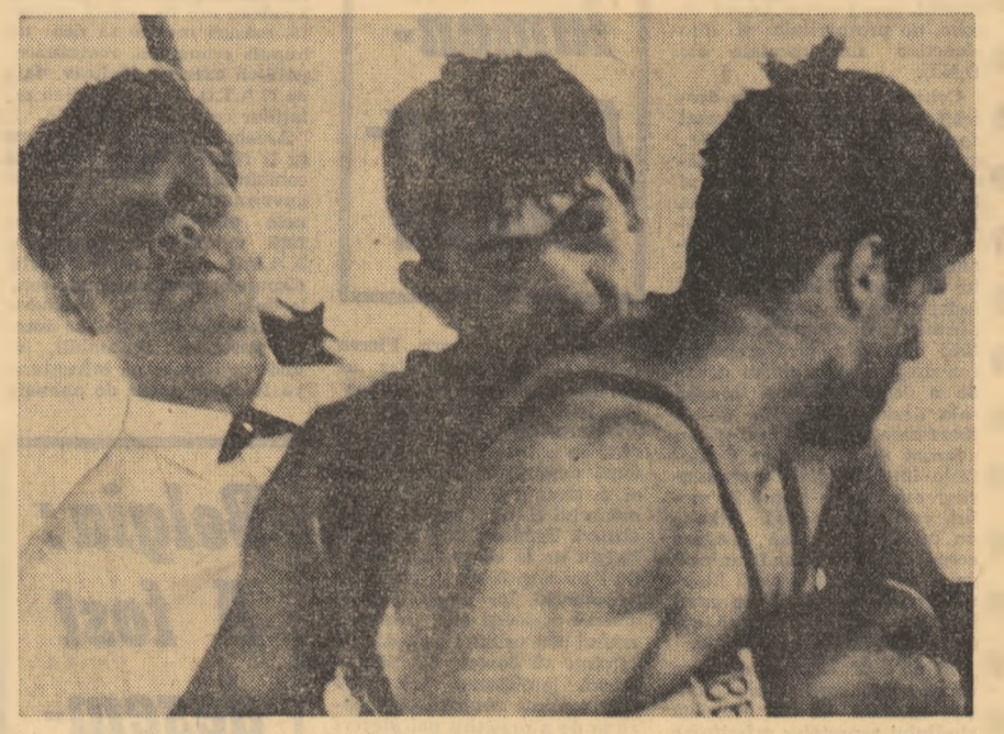
Protagonistii ringului...

Aseară — într-o convorbire telefonică cu Studiul de tele-viziune — am solicitat pentru cititorii noștri noi amănun-țe cu privire la transmiterea pe micul ecran a meciului amical de fotbal ROMANIA—AUSTRIA. Așa cum se știe, televiziunea a întreprins măsurile convenite ca această partidă de debut a anului, programată miercuri 1 Mai la Linz să fie transmisă în direct, în jurul orei 17.30.