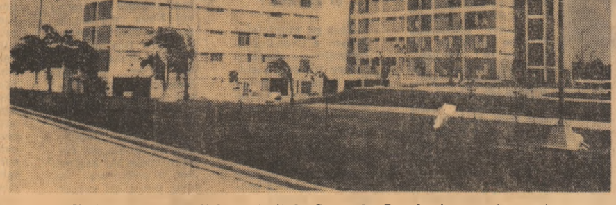
CUBA: un nou spital construit la Sagna la Grande, inaugurat recent.

mai bine de două săptămîni caut un dușog — a declarat el — pînă acum a trebuit să mă mulțumesc cu un monolog”. Cotidianul francez „Le Monde” conștient de declarația lui Collard drept „un avertisment dat social-creștinilor”, iar după „Le Figaro” precizînd că este demonstrat că el este dispus să renunțe la misiunea de formare a unui nou guvern.