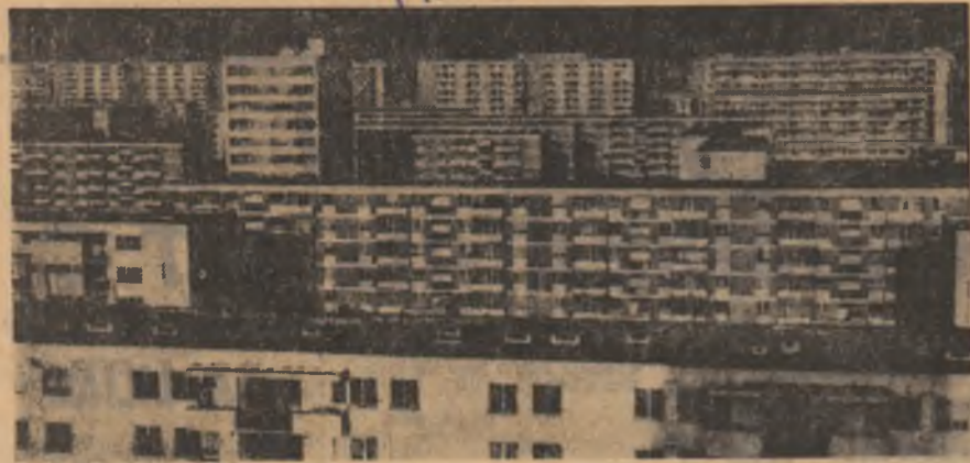
Din noul peisaj al carterului Baia Albă-București