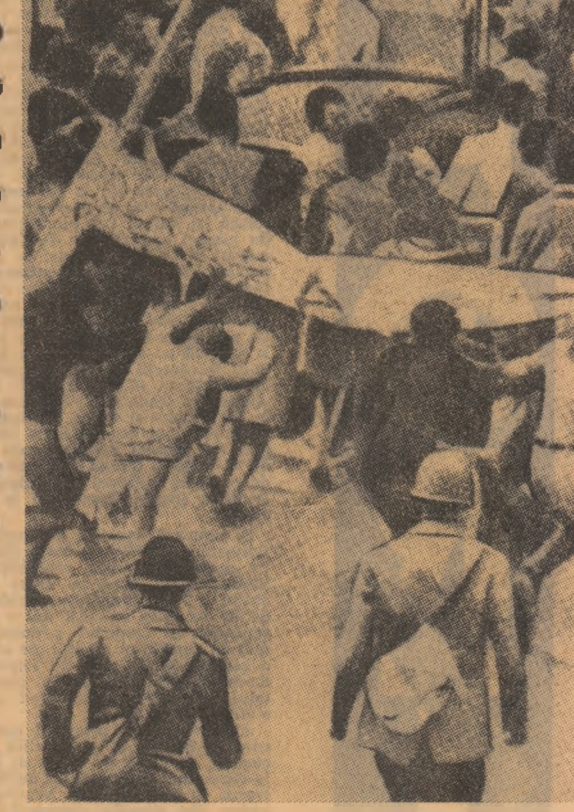
ROMA. În timpul recentelor ciocniri între studenți și poliție