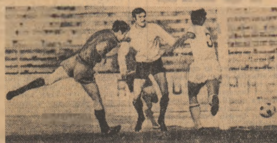
Voinea, cum rar i se întîmplă nu va mai greși de data aceasta...