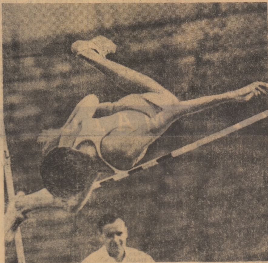
Anii de antrenament transformați în... clipe