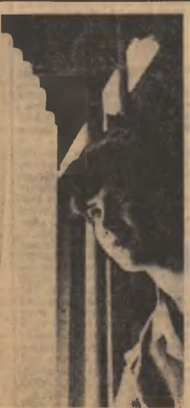
„Electrofar”-București (secția lămpilor fluorescente). Ultimul control înainte de-a ieși pe porțile fabricii