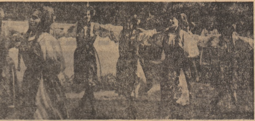
Dans brațorean