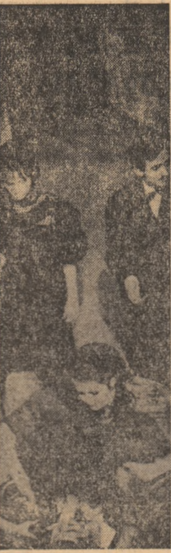
100 de ani de la nașterea lui Pirandello. Reușită evocare a studenților clujești...