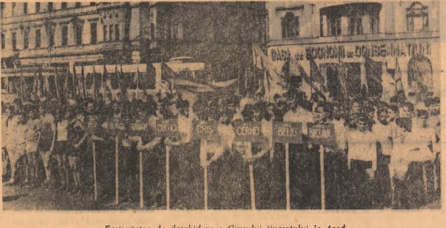
Festivitatea de deschidere a Crosului tineretului la Arad