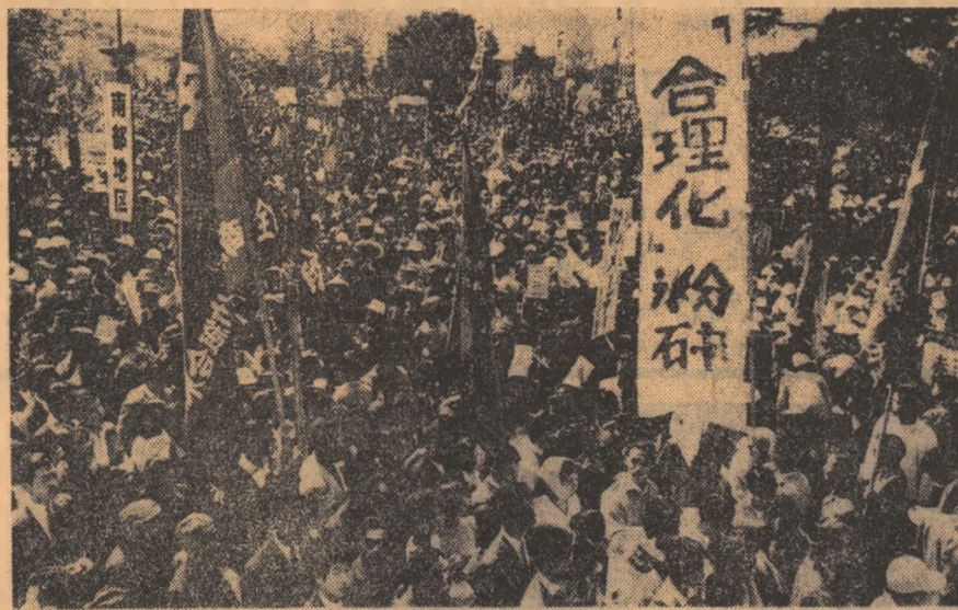
JAPONIA: Aspect din timpul unei recente manifestații a oamenilor muncii în sprijinul revendicărilor lor

Comentariul de presă, prezentat aici la Paris, își exprimă părerea că delegația S.U.A. a manifestat o poziție rigidă, nu a dat dovadă de nici un semn de bunăvoință în această primă zi a convorbirilor oficiale între delegațiile S.U.A. și R. D. Vietnam.