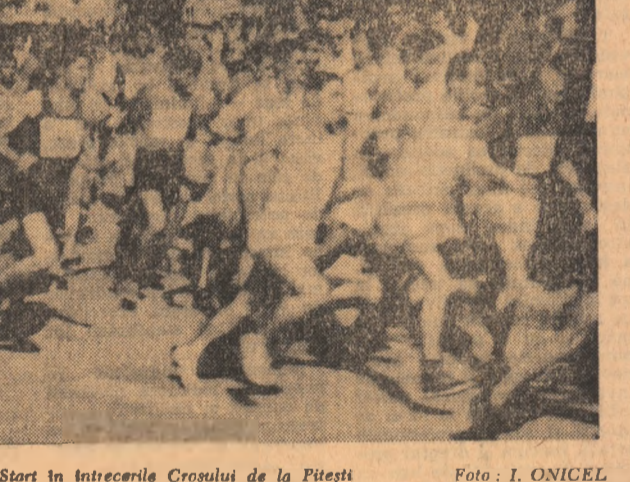
Start în întrecerile Crosului de la Pitești

În jurul orei 12 — Transmisivitatea în direct de la Aeroportul Băneasa din Capitală a sosit președintele Republicii Franceze, generalul Charles de Gaulle; 17.30 — Pentru cei mici: Ecranul cu păpuși; „Puncta de aur” de Veronica Forumbacu și Victoria Filipoiu după Ion Creangă; 18.00 — T.V. pentru specialiștii din industrie, „Automatizarea” — partea a II-a; 18.30 — Curs de limba engleză (lectia a 16-a); 19.00 — T.V. pentru școlarii România pitorască: „Apa Bistriței povestește”; 19.30 — Televiziunea de seară; 20.00 — Film serial: „Thierry la Fronde”; 20.45 — Seară de teatru „Viața e vis” de Calderon de la Barca. În pauză: Posta T.V.; 22.45 — Televiziunea de noapte.