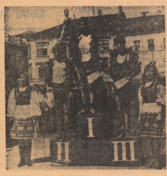
Festivitatea de premiere