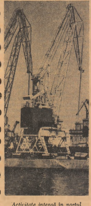
Activitate intensă în portul Constanța

PLOIEȘTI. La uzina mecanică Teleajen, județul Prahova — unitate specializată în construcții și reparatii de utilitaje petroliere, — a început construcția unei hale industriale pentru secția de turnătorie de oțel. Aici se vor putea realiza anual 4 200 tone piese de schimb pentru utilitaje petroliere, precum și role de tractor folosite în schele. Se prevede ca noul obiectiv să intre în producție în anul 1969. BRĂILA. — La prima fabrică de carboximeții celulozici din țară, ce se construiește pe linia Combinatului de fibre artificiale din Brăila, a început montajul utilităților tehnologice, unitatea urmînd să intre în funcțiune la sfîrșitul acestui an. Folosind ca materie primă celuloza inferioară, nua fabrică va realiza anual 5000 tone carboximeții, ce va fi utilizat în industria extractivă și de detergenți. (Agerpres)