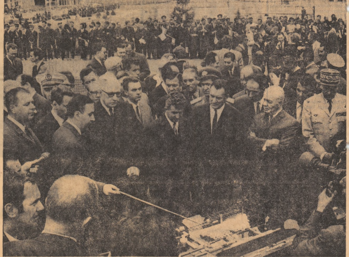
În vizită la centrala electrică de termoficare

vă văd pe dumneavoastră, pe unu a fi convins că acesta este drumul cel bun. Sîntem în mers. Sîntem acest lucru și îl afirm. Franța și România înainteză spre același țel care se numește Europa — pacea mondială și progresul omenirii. Realizăm această avînt în momentul de față regimuri diferite, dar noi îl realizăm ca oameni, deoarece în toate regimurile omenii sînt oameni, în realizăm ca frați, deoarece oamenii trebuie să fie frați și îndeosebi românii și francezii. În urma convorbirilor pe care le-am avut cu domnul președinte Ceaușescu, duc cu mine încrederea totală în prietenia noastră și, de asemenea, în acțiunea noastră comună. Din tot ceea ce am văzut și am auzit despre poporul dv., îndeosebi din cele văzute la Craiova, duc cu mine o amintire de neuit. În încheiere, ca și la început, vă spun: mulțumesc! Hai să dăm mîna cu mîna! Trăiască Craiova! Trăiască România! Trăiască prietenia româno-franceză! (Cuvîntarea președintelui Republicii Franceze, generalul Charles de Gaulle, a fost subliniată în repetate rînduri de ovatii, urale și aplauze puternice).