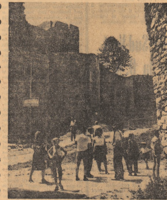
In vizită la Cetatea Neamțului