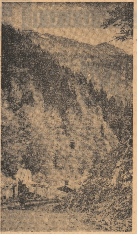
Pe drum de munte...