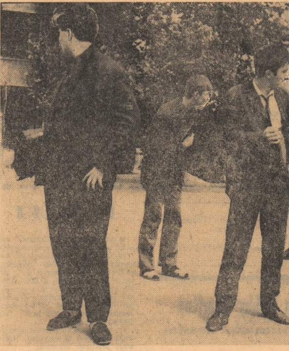
„Mă, ne vede cineva, sau putem să fumăm liniștiți?”