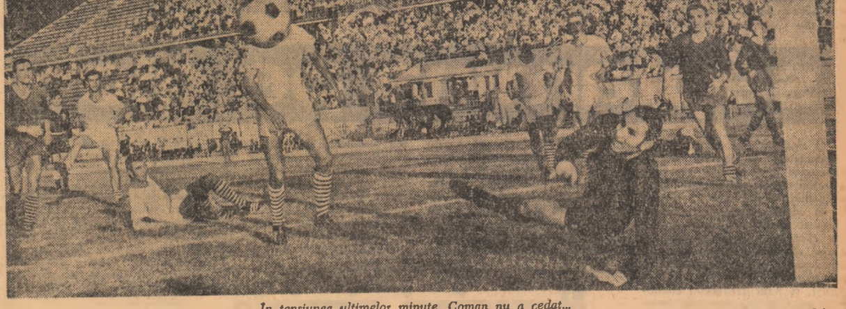
În tensiunea ultimelor minute, Coman nu a cedat...

ION GHITULESCU — crainic reporter — Un campionat consumat