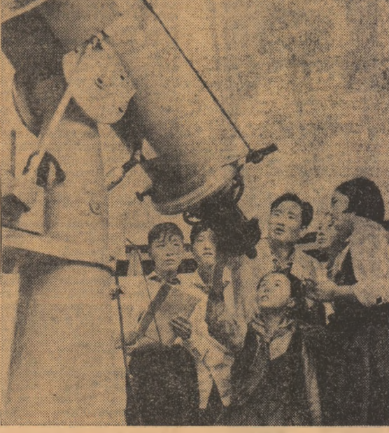
PHENIAN. — La micul observator astronomic al Palatului pionierilor