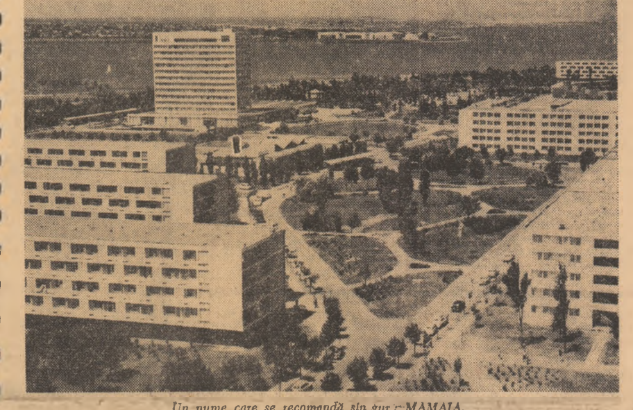
Un nume care se recomandă sin gură: MAMAIA.

te cantități de cupru de convertitor, sulfat de fier și acid sulfuric și alte produ-se. În primele 5 luni ale a-nului, producția marfă vin-dută și încasată a fost de-pășită cu 17 494 000 lei, s-au realizat 3 232 000 lei econo-mii peste plan și 3 800 000 lei beneficii suplimentare. (Agerpres)