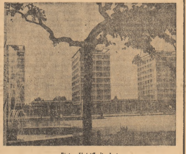
Piața „Unirii” din Iași