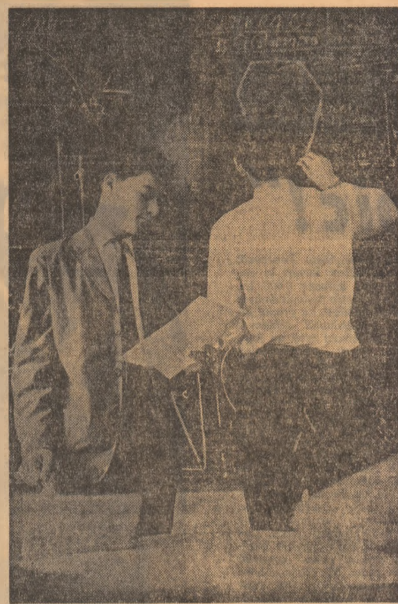
Cadru de examen: studenți de la Facultatea de metalurgie