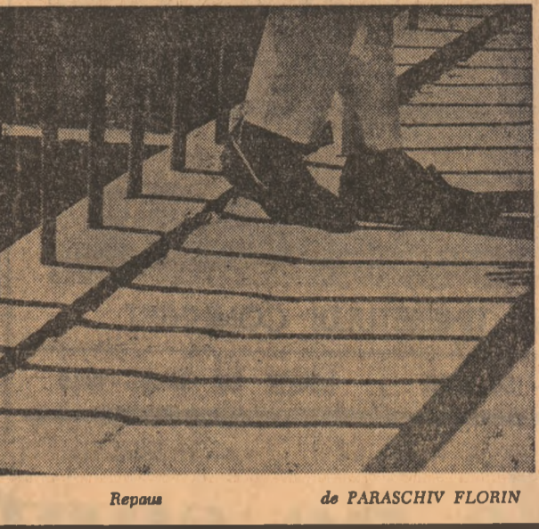
Repaș de PARASCHIV FLORIN