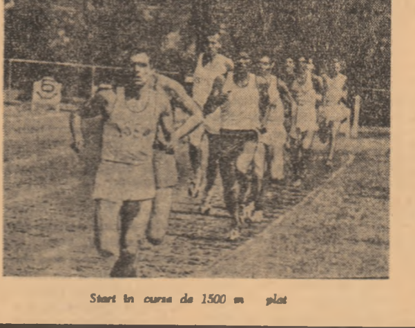
Start în cursa de 1500 m plat