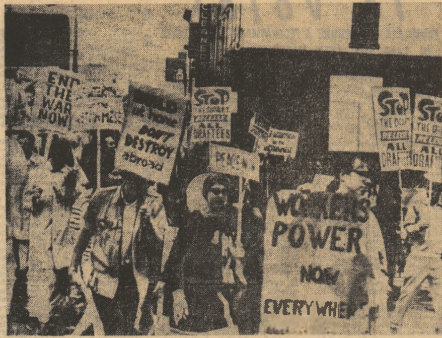
S.U.A.: Demonstrație antirăzboinică la Washington

În același timp, avioane americane de tip B-52 au bombardat regiuni din jurul Saigonului unde patrioții și-au intensificat tot mai mult acțiunile în ultima vreme.