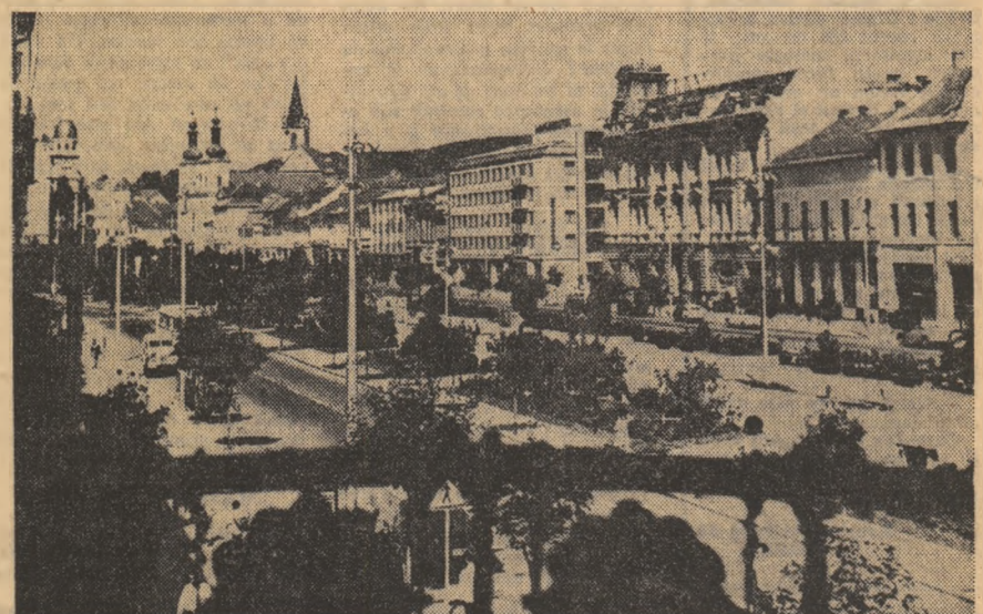
Ilustrată din Tg. Mureș