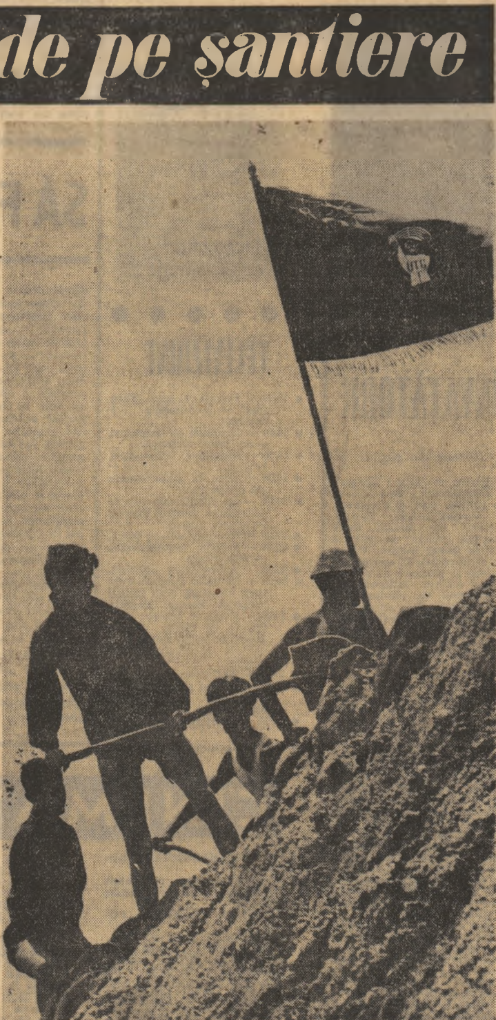
Zilnic drapelul brigăzii marchează locul de muncă al echipei fruntașe. Spre înălțimea unde el filiaje în adierea vântului se îndreaptă gândurile tuturor brigadierilor: „și va cuceri oare astăzi echipa noastră?”