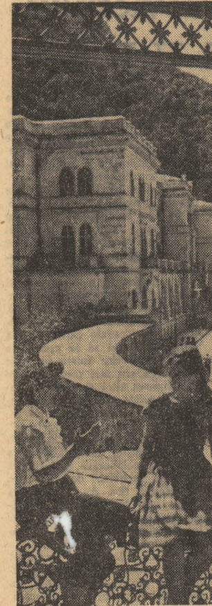
In concediu la Baile Herculane