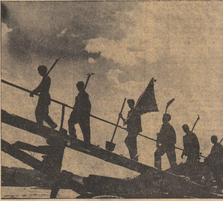
In drum spre tabără