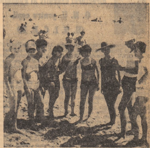
statat că din orașul nostru sînt cîteva zeci de studenți...