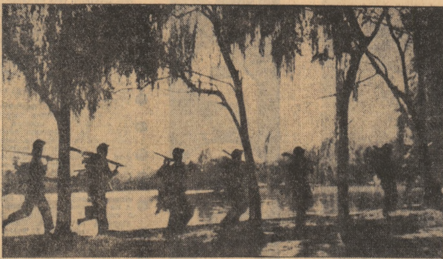
R. D. VIETNAM: A sunat alarma aeriană. Gărzile locale își ocupă posturile pentru respingerea atacului aviației americane

— Exact. Aș dori însă să definesc de la început rolul UNICEF. L-aș numi un rol de catalizator al eforturilor țărilor slab dezvoltate pentru îmbunătățirea condițiilor de viață și educație a copiilor. Firește, și în acest domeniu, ca și în toate domeniile, acțiunii pentru progres material și spiritual, baza, esențialul, rămîne efortul național, efortul fiecărei țări, al fiecărei națiuni. În acest sens, ceea ce încearcă UNICEF să facă este să ajute la crearea unor „impulsuri inițiale” care să permită dezvoltarea unor eforturi și ac-