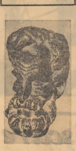
ROMUL LADEA: „Simion Bărnuțiu”