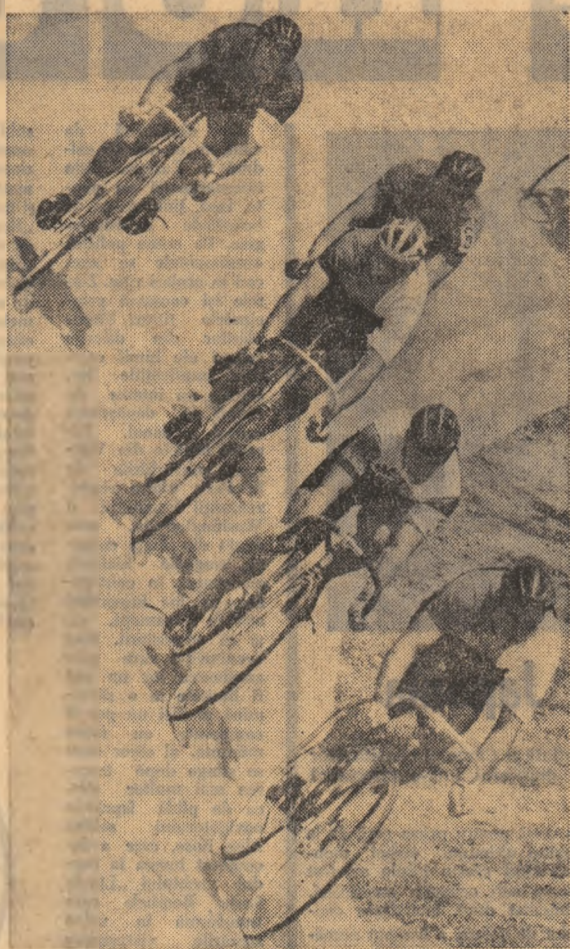
Sub un soare neteritor, participanții la „cursa americană” își dispută cu ardora șansele