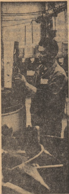
Atenție încordată la verificarea bilelor (Aspect din secția bile — Uzinele „Rulmentul”-Brașov)

În pag. a III-a ● Noi mijloace de transport pe planșetele proiectanților — Ancheta noastră pe teme științifice