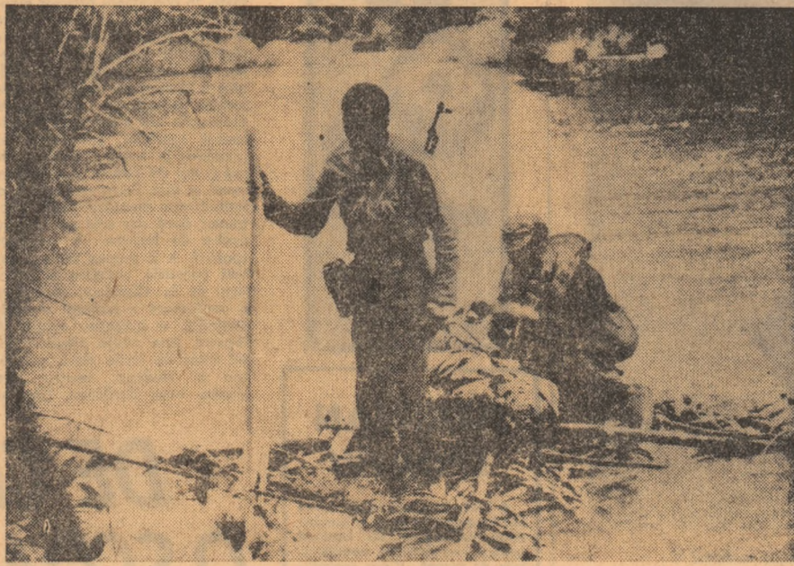
Patrioți angolezi în misiune de luptă

În capitala Ecuadorului, Quito, au avut loc miercuri manifestații ale țărânilor în semn de protest față de incidentele petrecute săptămîina trecută în provincia Loja. Țărâni din regiunea Loja, cel mai greu lovit de seceta din acest sezon au ocupat o serie de pămînturi părăsite, de la ferma „Santa Ana”. Poliția a intervenit făcînd uz de arme, omorînd 10 țărâni și rîndind alți 20. Manifestanții au ajuns în fața palatului prezidențial unde au prezentat cererile lor președintelui țării, Otto Arosemena. Președintele Arosemena a declarat că „vinovății vor fi pedepsiți”, dar a absolvit guvernul de orice răspundere pentru aceste incidente.