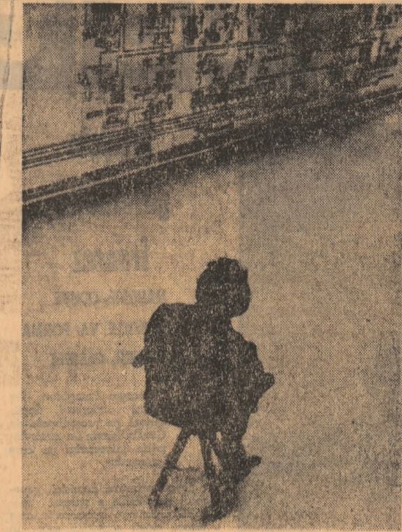
Pictură modernistă sau tehnică modernă?