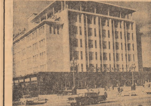
Construcții moderne la Ulan Bator

Locuitorii din regiunea nordică a podișului Gobi spun cu mîndrie că dezvoltarea orașului Darhan a însemnat ridicarea la o nouă viață a unor întinderi ale stepelor mongole. Cu numai cîteva ani în urmă, orașul Darhan era însemnat pe hărți doar ca un nod de cale ferată. Programul de industria-