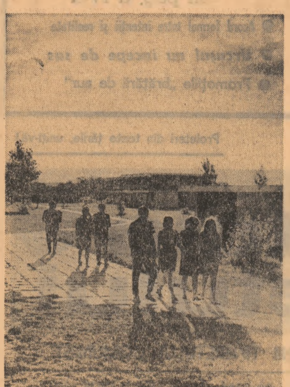
În amurg la Costinești

dele — unul din pionierii ra- ționale-moralismului an — de aci noastră școlară. De aci a por- nit inițiativa organizării unui concurs național cu micile și modernele aparate — a cărui primă ediție a și avut loc în primăvara anului 1963. În această pleacă și se întoarce o întreagă corespondență cu cercuri simi- lare din alte țări, aici izvoacă idei proiecte, nu numai de aparate și și privind viitorul unor dintre membrii săi. Și, în sfîrșit, în plină ac- tivitate se află și membrii cer- cului de artă plastică. Adunați în grupuri mai mari sau mai mici, tinerii artiști străbat în aceste zile melezurile vechii reședințe domestice în căutarea „inspirației“. Se nasc tablouri cu motive istorice, natura gene- roasă este imortalizată pe pînă, extrăși unor chipuri noi, ne- cunoscute pînă acum dar im-ediat îndrăgite este prînsă în fuga creionului pentru a fi stu- diată, interpretată. Existența acestor preocupări de vară, vădînd pasiv și inter- esate certe, ne-a convins încă o dată că vacanța nu poate fi închisată în niste forme fixe, că ea lasă amintiri de neuită în memoria beneficiarilor ei nu- mai dacă răspunde cu prompti- tudine preocupărilor lor reale. LA CLUB — ACTIVITATEA SE DESFAȘOARĂ... „AȘA ȘI AȘA“ Cum merg cluburile în va- canță? Merg — acesta este răs- punsul exact. Adică, în „Tir-