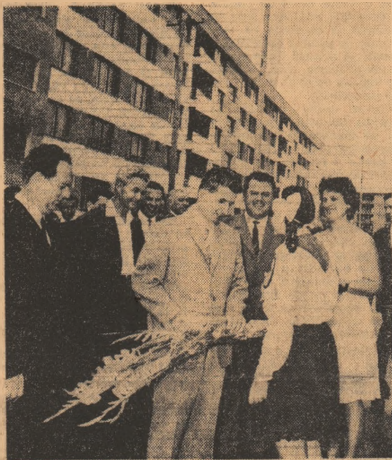
Înălții oaspeții sînt întâmpinați cu căldură de locuitorii Brăilei

Tovarășii Nicolae Ceaușescu, Ion Gheorghe Maurer, Paul Niculescu-Mizil, Virgil Trofin, Ilie Verdet au sosit marți dimineața în municipiul Brăila în continuarea vizitei de lucru întreprinsă în această parte a țării. Populația orașului a întâmpinat cu sentimente de profund atașament pe conducătorii partidului și statului, și-a manifestat deplina aderență față de politica internă și externă a partidului și statului nostru.