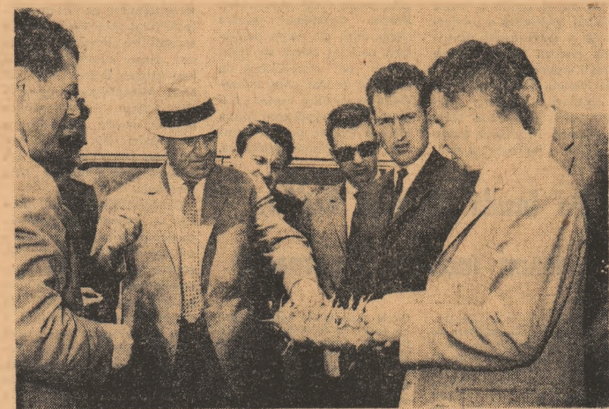
Pe Insula Mare a Brăilei