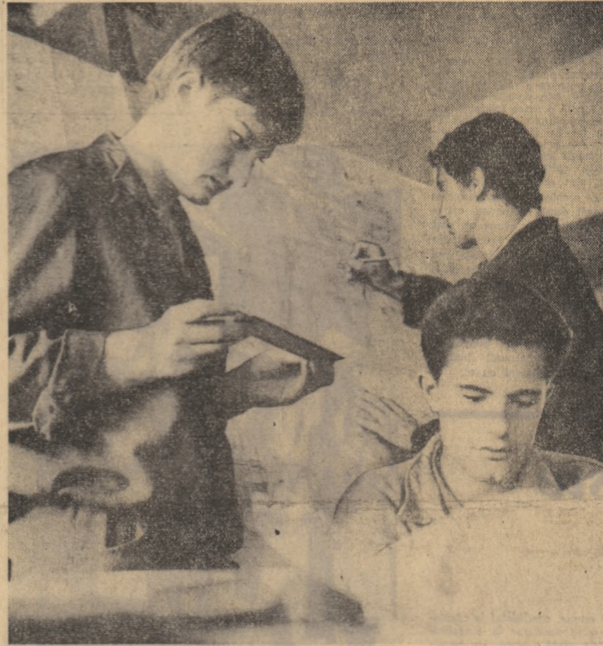
Viitor proiectanți — în fața planșetelor (studenții ai Facultății de tehnologia construcțiilor de mașini, secția mașini-unelte, în practică la F.M.U.A.B.).

— Cîț privește nivelul calitatii produselor noastre, vreau să precizez că ne-a venit în sprijin îmbunătățirea radicală a materiei prime folosite, în special celuloza românească tip foaie, a finut ad na precizie tovarășul director comercial al combinatului.