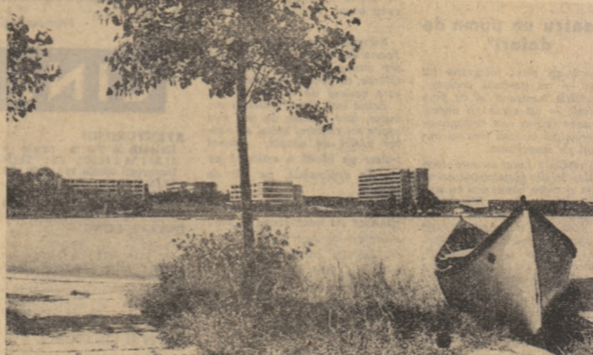
Mangalia-Nord: întro mare și stațiune un lac cu apă dulce