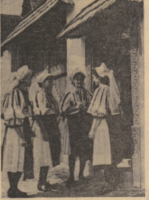
Frumoase sălcițence stînd de tîind