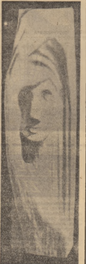
Cine-mi va spune