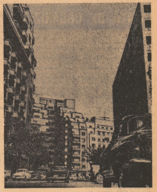
Privire, spre una din magistralele bucureștene

Medicina trebuie să se bazeze pe principiile etice tradiționale și anume să înceapă prin primum non nocere și să sfîrșească prin ultimum non nocere, adică, de la început pînă la sfîrșit medicul trebuie să fie grijuliu, nu numai cu trupul pacientului ci și cu sufletul lui și în ultimă instanță trebuie să fie foarte grijuliu cu societatea pentru că loveste un individ ci loveste o întreagă (esătură) de relații sociale pe care modificîndu-le produce o anumită morbiditate morală care scapă de sub imperiul medical și infestază cercuri largi de populație.