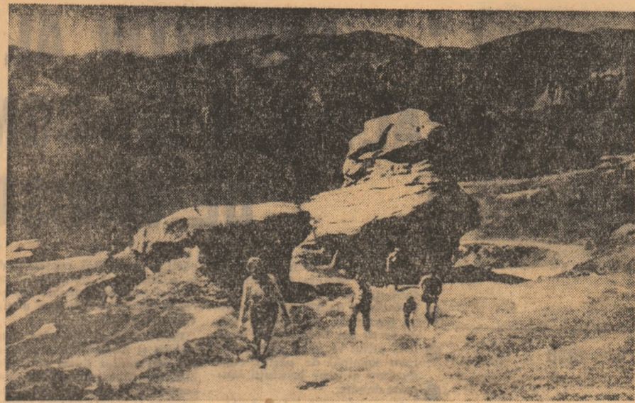
O poză în fața Babelor și... înapoi la cabană

Au scris „Scinteia Tineretului” TURISTI, OPRITI-VĂ SI LA ISCRONI... GH. BOZU, tehnician. Lupeți: Lingă Iscroni, înalte de a ajunge pe socoa la Petrosani, trecătorii se o-press în fața unui arbore — monument al naturii. Origina- riu din pădurile Indiei, ar- borele s-a acomodat cu clima Văii Jiului. Acum, după o pauză de mai mulți ani, ar- borele a primit în coroana sa multimea de lalele aurii care i dau un farmec aparte. Pare un copac împodobit artificial de o mină nevăzută. Falmica sa înfățișare, podoaba florilor pe care le poartă, cu mîndrie parca, constituie un punct de atrac- ție pentru mulți turiști. Dacă treceti spre Petrosani, opriti-vă și la Iscroni. Puteți vedea o curiozitate a naturii în jocul ei vătăto cu frumosul.