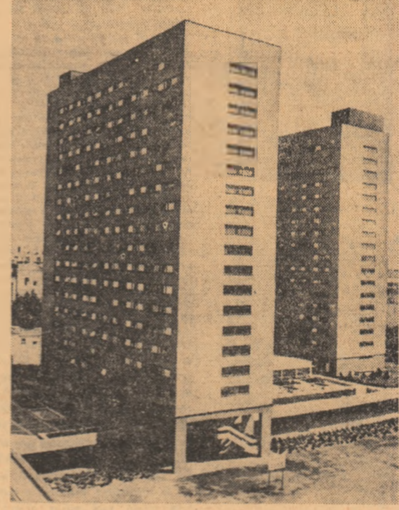
AUSTRIA. Clădiri ale unui nou centru spitalicesc din Viena.