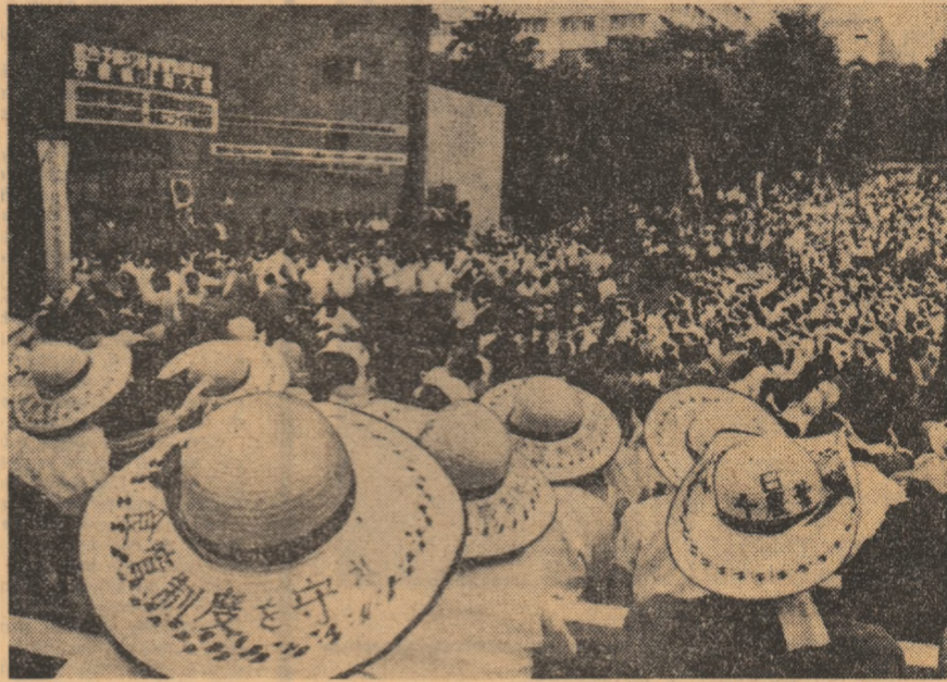
JAPONIA: Aspect de la o demonstrație a țăranilor în sprijinul revendicărilor lor.

SAIGON 24 (Agerpres). — Comitetul Central al Frontului Național de Eliberare din Vietnamul de sud a dat publicității o declarație în legătură cu reuniunea de la Honolulu, la care au participat președintele Johnson și șeful regimentului Nguyen Van Thieu. Afirmățiile privind așa-numita „agresiune” a R. D. Vietnam împotriva sudului și „angajamentului” S.U.A. față de regiunile de la Saigon — se arată în declarație — denaturează sensul adevărat al luptei de rezistență a poporului sud-vietnamez.