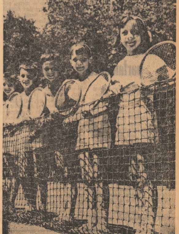
A fost înșușită literatura „A”.