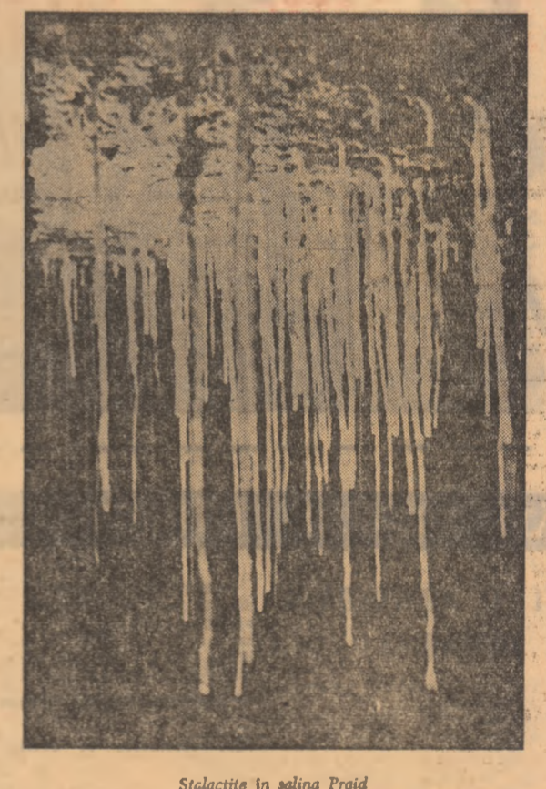
Stalactite în salina Praid