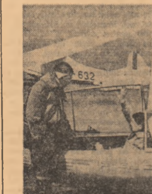
In zi de antrenament.

Miercuri s-a înapoiat în portul Constanța, bricul „Mircea”, nava școlii militare superioare de marină, care a făcut o călătorie de curiozitate în Italia, la Napoli.