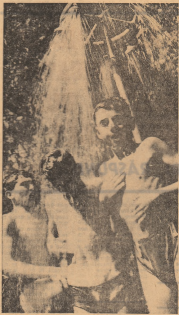
Un duș la bazinul Clubului „Cutezătorii”

rită, a dăunat. Fîndcă tinerii din sală le-au fost înțelese acceptările, unii din ei pierzîndu-și încrederea, alții spunîndu-și cel puțin în gînd că nu vor mai participa la asemenea acțiuni. Și nu trebuie să ne mire un astfel de raționament. Se impuneau deci eforturi din partea organizației respectiv pentru re-