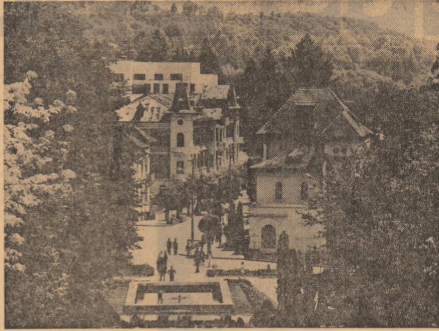
Imagine din stațiunea Gocora