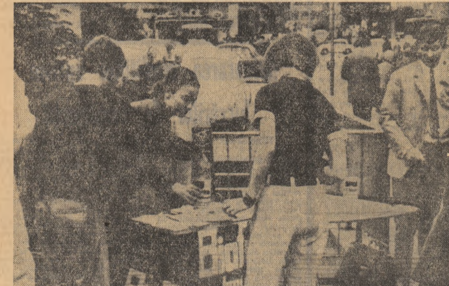
R. F. A. GERMANIEI. Colectă organizată la Frankfurt pe Main, pentru ajutorarea victimelor conflictului nigeriano-biafrez