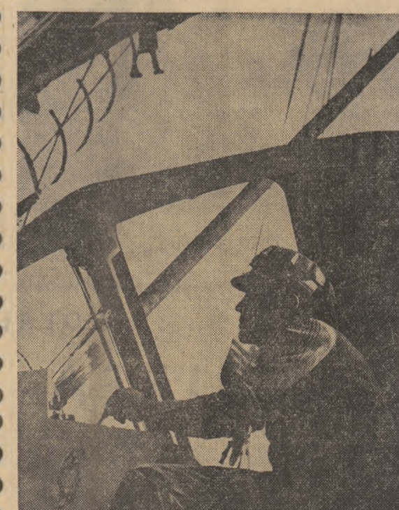
Uriașul de metal se supune docil măiestriei omului

Locul și rolul tînrului în viața satului contemporan