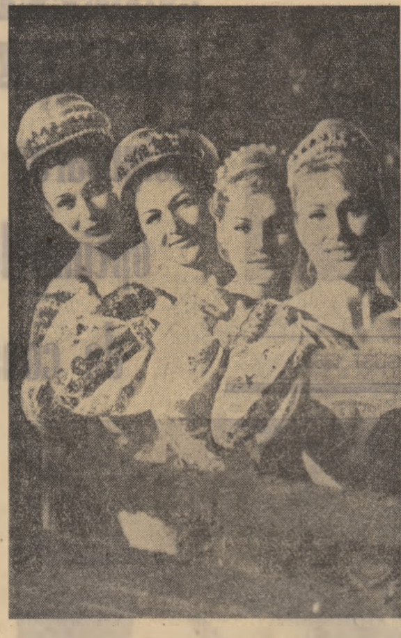
Zimbetul Hnereții

dionisiac (și cu vîta de vie înunundu-mă babilic) și nici pilliatih care să clote livezi și poame, deși s-ar zice că există versuri care răz, ne contrastă „aurul născut pentru stele / mirosl pentru creșterea fructelor / tot ceea ce se desprinde de mine / întorcîndu-se înmuit / / forțându-se a suprașuă / pe toamna strămose.” Am spus mai degrabă că adevăratul Grigore Hagiu este un meditativ cu o specifică viziune distanță asupra lumii. El a avut puterea să ajungă la o anume înțelegere a lucrurilor de sorgine filozofice urmînd astfel o traiectorie pe care a conceput-o și a ilustrat-o în literatura română Eminescu. Poetul tinde spre „însemnare” pînă la acea „implicare” care este a solemnității interioare. Și totuși prin gesturi și nicio dată un hieratic, se refuză rigidității, nu se teme să-și facă din obiectele umile metaforele (p. 142) care sistului așa înclă, și asta am lntia mai degrabă în zona psihologicului și doar într-o mică măsură în cea a specificului creativității exteriorizate. În esență s-a poeziei nu ni s-a părut nici un