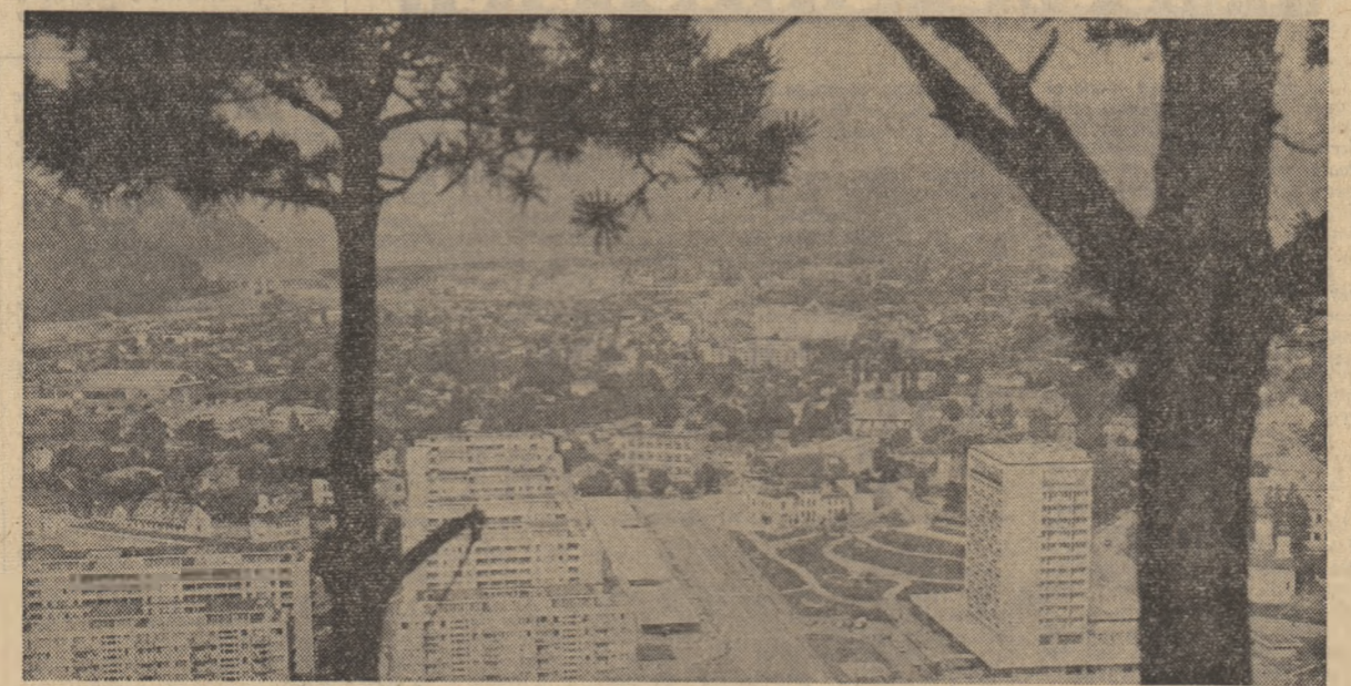
SĂ DISCUTĂM DESPRE TINEREȚE, EDUCAȚIE, RĂSPUNDERI