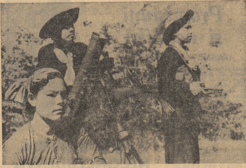
VIETNAMUL DE SUD. Tinere dintr-o unitate de mortiere a F.N.E.