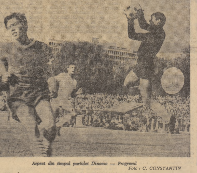
Aspect din timpul partidei Dinamo - Progresul