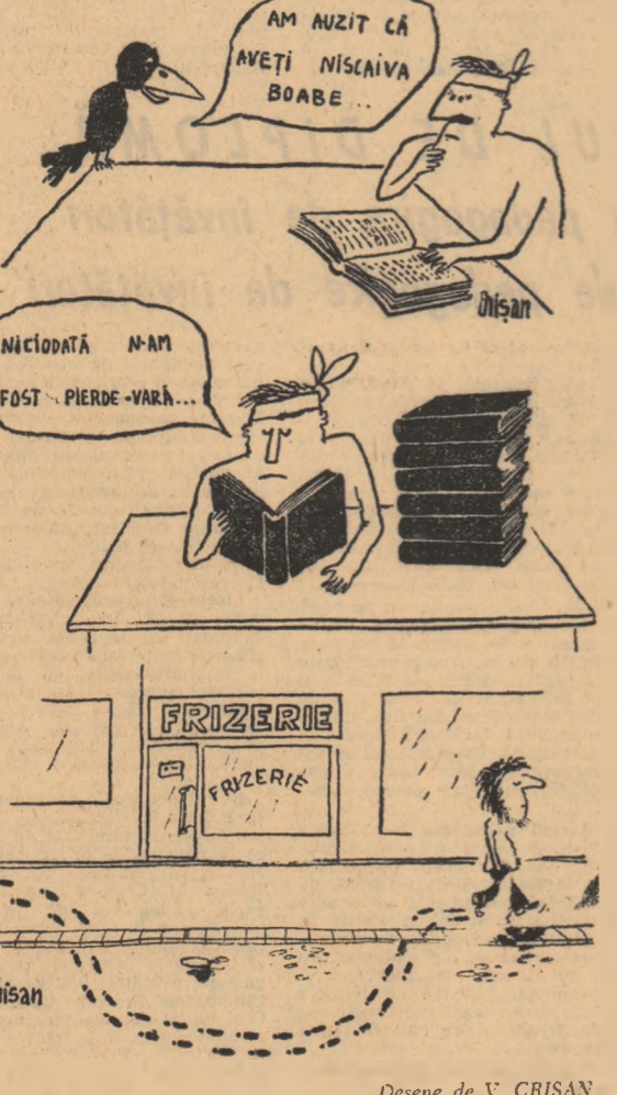
Desene de V. CRIȘAN

Instrument de lucru fundamental, esențial necesar în activitatea cotidiană a studenților, ca ghid pentru studiul individual, manualul universitar constituie unul din primele puncte de pornire în parcursul de a căuta și a realiza bibliografii de specialitate, din primul și pînă în ultimul an de facultate. Fără el, în așteptarea unui nou an universitar, studenții își afirmă dorința de a cunoaște noutățile ce intervin, începînd cu 1 octombrie pentru ce discipline și cînd vor avea la îndemînă cursurile, îndrumătoarele de laborator și proiecte, culegerile de probleme necesare. Ca urmare a unei astfel de solicitări venite din partea unor studenți brașoveni, ne-am orientat investigațiile către Institutul politehnic din localitate. Așadar, viitorii ingineri așteaptă cumuri lucrări de specialitate. Ce li se oferă prin activitatea editorială?