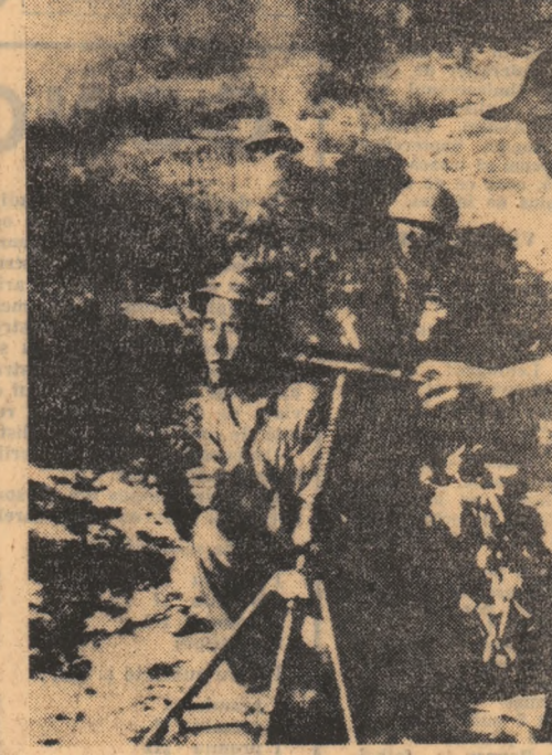
Patrioți sud-vietnamezi în timpul unei misiuni de luptă

În capitala Etiopiei se apreciază că se va da publicității un comunicat în legătură cu cea de-a treia întrunire dintre delegațiile prezente la tratative, într-o zi și organizații internaționalele victimelor civile ale războiului. După cum se știe, și în această problemă, ca și în aceea de ambianță a soluțiilor conflictului, pozițiile celor două delegații sînt profund diferite. Reprezentanții guvernului federal insistă asupra unui coridor în str. timp ce biruzele, temîndu-se că acesta ar putea facilita un atac federal împotriva pozițiilor lor, propun transportarea ajutoarelor pe calea aerului.