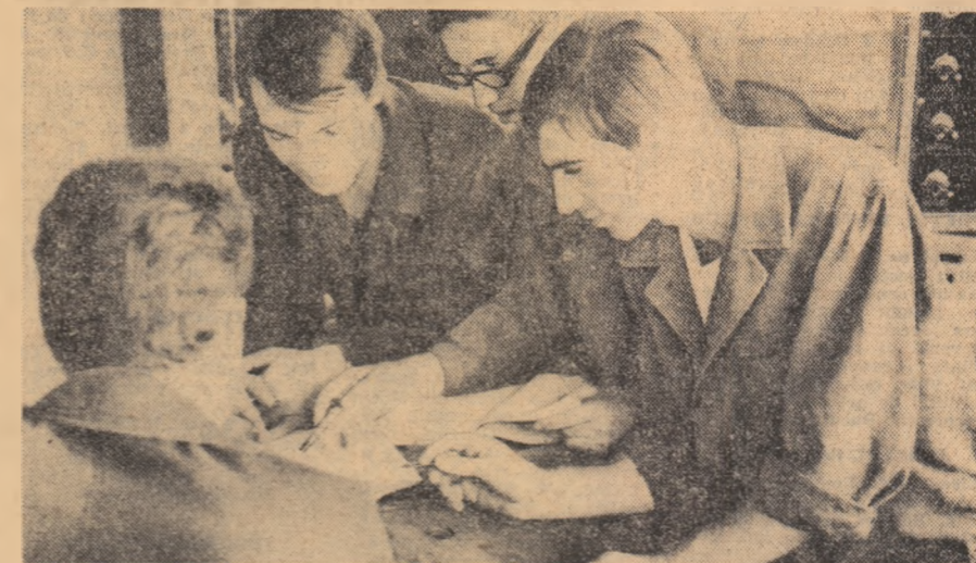
Secvență de studiu în timpul practicii în producție

Ieri au mai sosit în Capitală reprezentanții ai U.I.S. și ai studenților din Bulgaria și Polonia. Celelalte delegații sînt așteptate în cursul dimineții de astăzi.