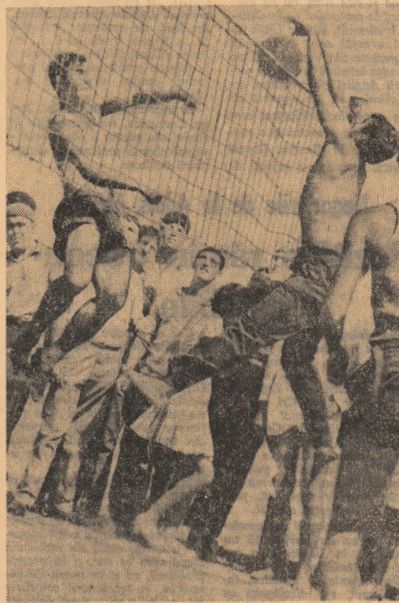
Secvență din întrecerile fazei pe centre de comună a 'Cupei Tineretului de la sat' disputate la Andrășești - Județul Iași...