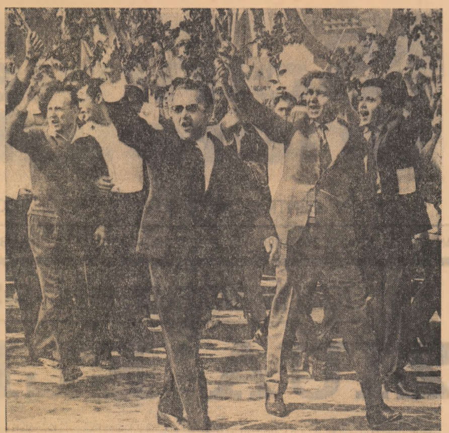
(Umare din pag. 1)