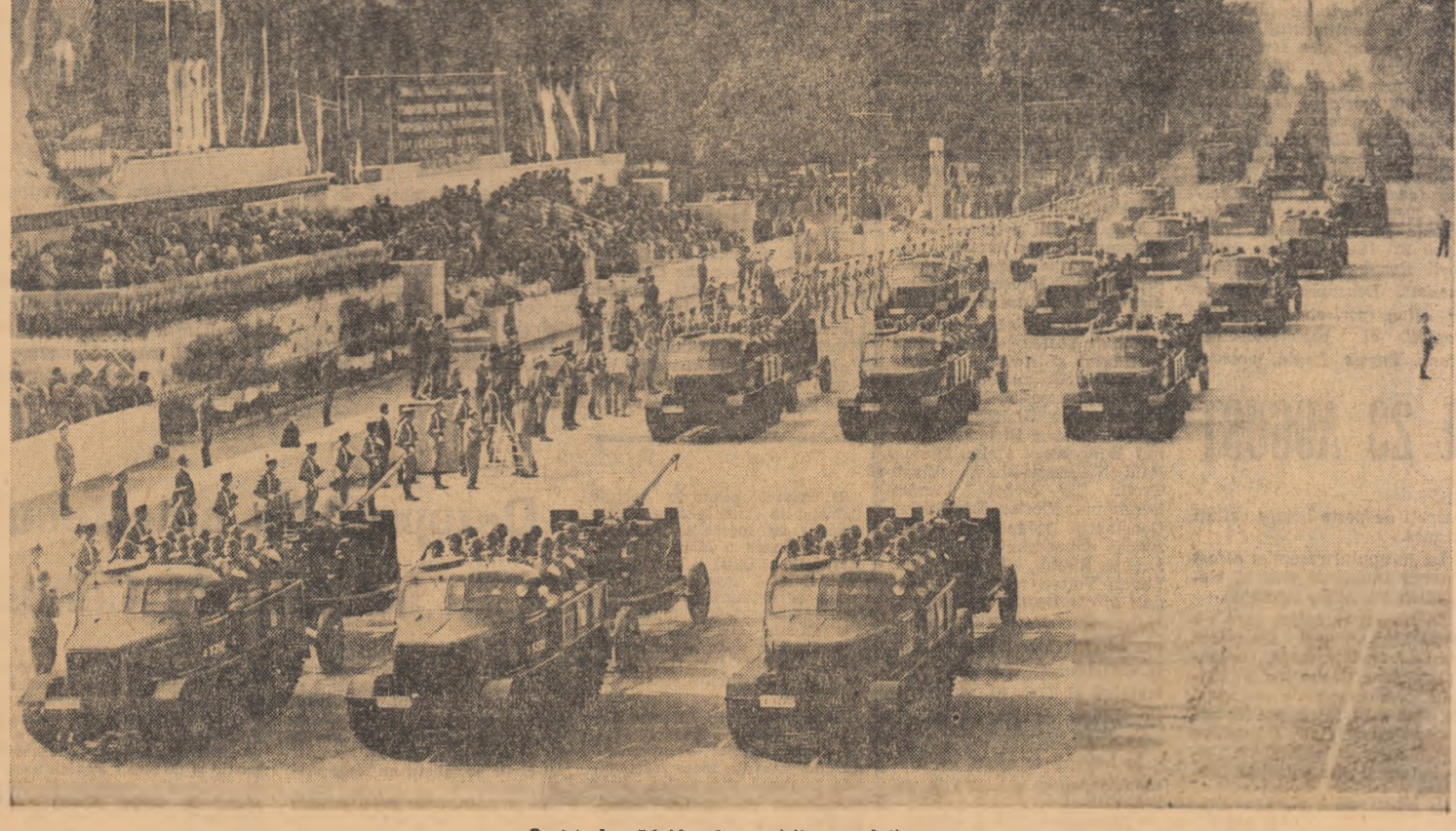
Scut de nădejde al cuceririlor revoluționare

Deși aflați în vacanță, un mare număr de studenți din Capitală s-au adunat în primele ore ale dimineții la facultățile lor. În Piața Universității, în Piața Romană — în fața clădirii Academiei de Studii Economice, în curtea Facultății de drept, în strada Polizu — la Politehnica bucureșteană, mii de tineri strîngeau rîndurile care, mai tîrziu, în Piața Aviatorilor aveau să formeze marea coloană a Centrului universitar București.