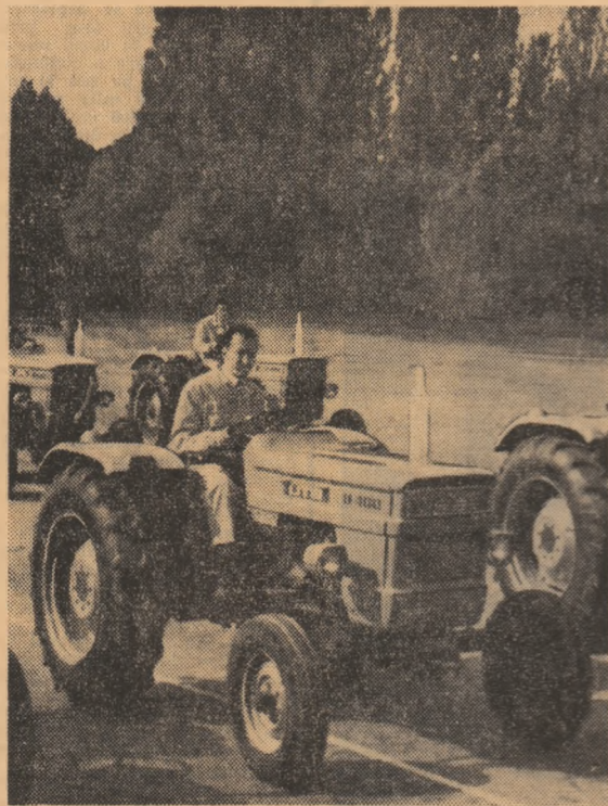
Noul tractor românesc „U-400”