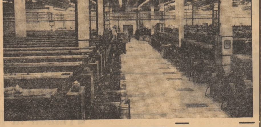
Aspect din secția de ringuri a Întreprinderii „Industria Lini” — Timișoara

„Cantina în care vor putea servi masa peste 3.000 de studenți și căminele cu 880 paturi din complexul Regie II, sînt deja predate beneficiarului. Totuși, se cere să sublinieze că aici Întreprinderea de construcții-montaj nr. 3, datorită faptului că a executat în pripă unele lucrări, este acum nevoită să facă unele modificări, stînjînd astfel instalarea mobilierului. Aceste remedieri nu pot fi tărăgădate; constructorul are obligația de a lua cele mai eficiente măsuri ca să accelereze ritmul lucrărilor...”