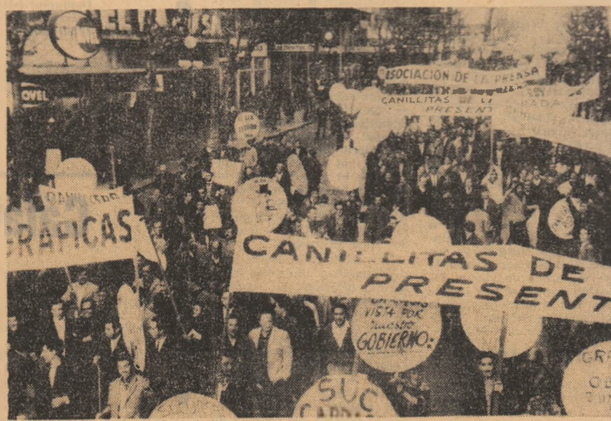
URUGUAY Demonstrație revendicativă a ziaristilor la Montevideo