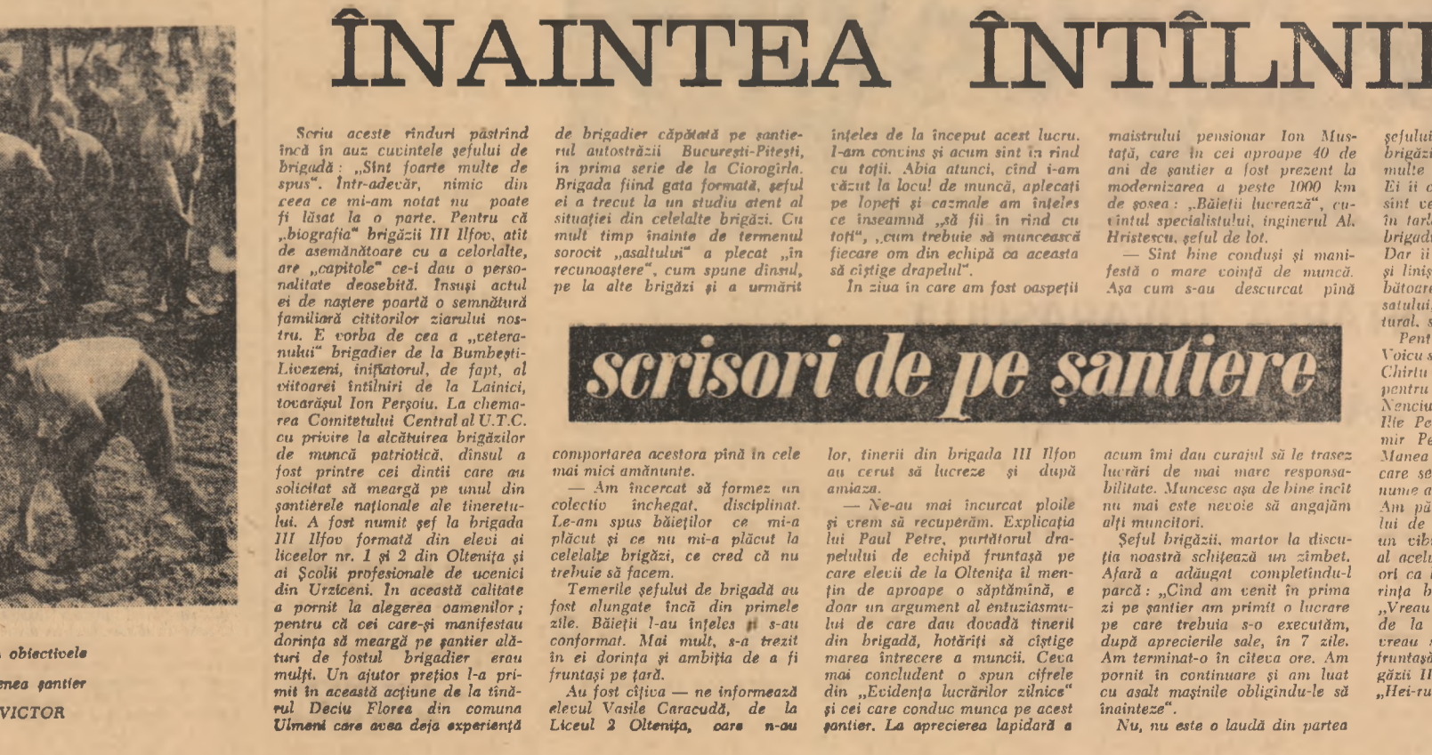
Amenajarea parcurilor și grădinilor constituie unul din obiectivele muncii patriotice. În foto: Aspect de pe un asemenea șantier.

— În cîteva minute se va acufunda! — Ne-a scăpat domnul Jonnes. Sper că valurile îl vor ascunde. Cîteva să cerceteze minutuos barca. Mihai ești gata? — Mihai îi răspunde cu un zîmbet ușor: — Pentru că îmi cunosc foarte bine marea! Dumnealui nu sînt vinde pitea altă noaptea. Ați văzut vreun mister? Hăitau sau acum cînd este răz? — Comandanul salupei îl replică: — Numai la șine! Sînt doar pescari sau vinători! — El bîbe, un maestru, rîsî și se adresă: „Mărită viteza! Accelerată!” — Apoi Mihai ordoană ofițerului său un subofiter tînăr, pușcaș, cu o figură pară de copil: — Mihai, îmbracă-ți costumul și pregătește armele subversive! Mărea viteză începe un alt act... Repede mai sînt doar cinci minute și pleacă „Pasla”! — Mihai, îmbracă-ți costumul și pregătește armele subversive! Mărea viteză începe un alt act... Repede mai sînt doar cinci minute și pleacă „Pasla”! — Mihai, îmbracă-ți costumul și pregătește armele subversive! Mărea viteză începe un alt act... Repede mai sînt doar cinci minute și pleacă „Pasla”!