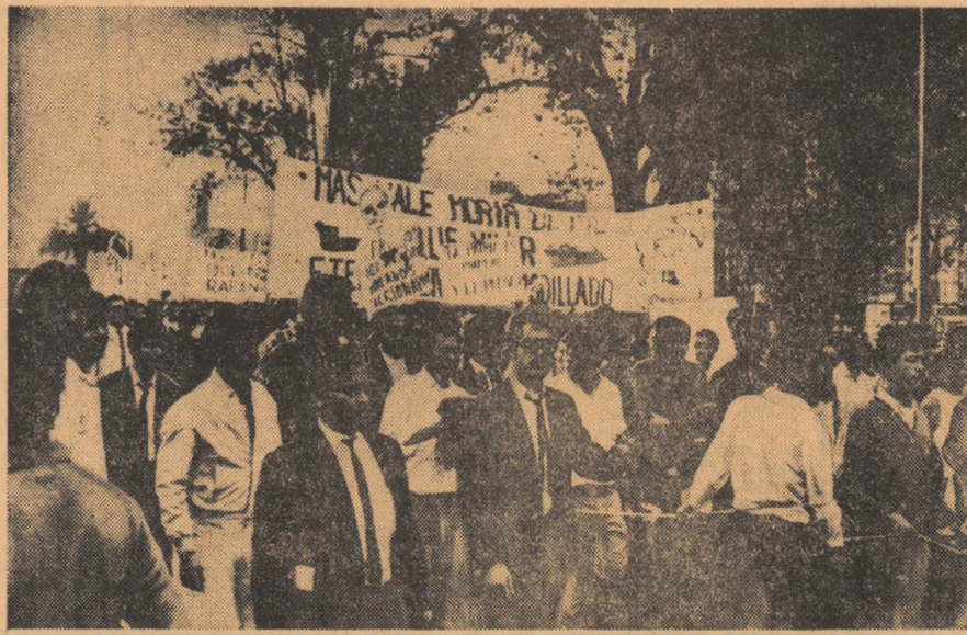
MEXIC. — Aspect de la recente demonstrații de la Ciudad de Mexico

Primele informații cu privire la operațiunile militare în Vietnamul de sud, de marți seara și în cursul nopții spre miercuri arată că forțele patriotice au atacat cu grenade în plin centrul Saigonului o clădire a oficialităților americane. Mai mulți funcționari americani au fost răniți. De asemenea, detașamentul F.N.E. au aruncat în aer un pod situat la 2 km de Ho Chi Minh, capitala provinciei Kien Giang, din regiunea Deltai fluviului Mekong. Prin distrugerea acestui punct strategic, scrie agenția France Presse, a fost tăiată din nou una din căile de aprovizionare a Saigonului.