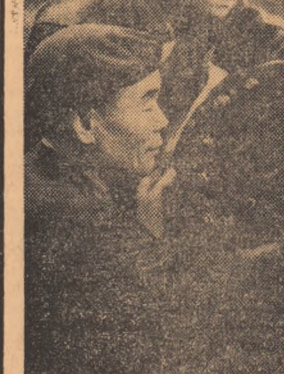
R. P. D. COREEANĂ. — La uzina de mașini electrice Dai-an

Construcții noi la Taşkent. La Taşkent, oraș care, după cum se știe, a avut mult de suferit anul trecut de urma numeroaselor cutremure, a început construcția unei clădiri de 9 etaje, capabilă să reziste unor cutremure de gradul 9. Clădirea se construiește din elemente prefabricate, confecționate la Combinatul de construcții din localitate.