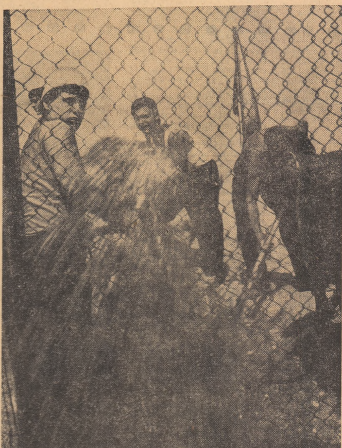
Sub soarele fierbinte al verii, la construcția șoselei sau la amenajarea canalelor pentru irigații, pretinzându-și înălțimea de brigădieri și-au semnalat prezența cu rezultate deosebite înscrisse în marea carte a muncii socialiste.