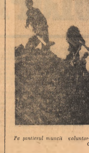
Pe șantierul muncii voluntar-patriotice de la C.A.P. „9 Mai”-Giurgiu