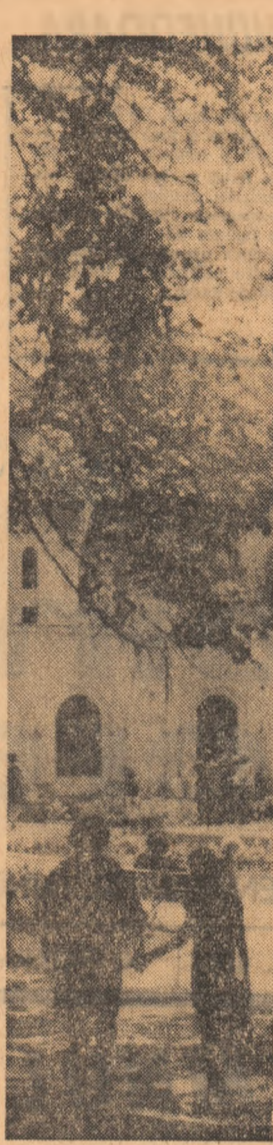
LA ODIHNA