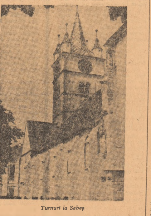
Turnul la Sebeș

Combinatul de cauciuc sintetic din orașul Georgeheo Georgeheo-Dej a primit o nouă promoție de tineri muncitori. Cei 126 de absolvenți ai școlii profesionale lucrează în prezent ca operatori chimiști, mecanici pom-