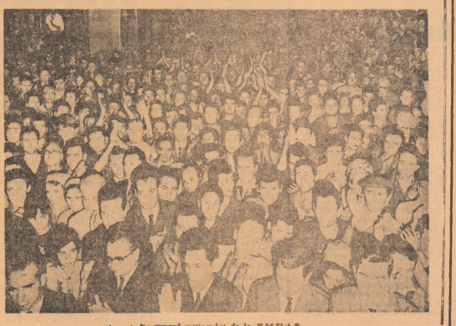
Aspect din timpul întrunirii de la F.M.U.A.