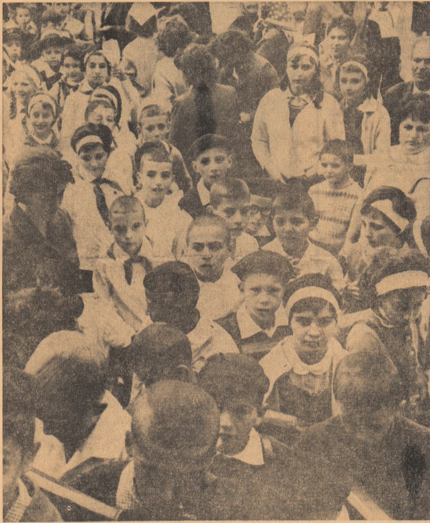
Mereu aceeași și totuși inedită: prima zi de școală