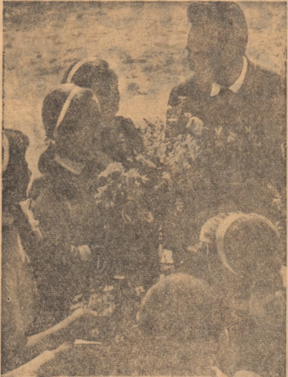
Bine v-am găsit, tovarășe profesor!

Vă urez, dragii elevi, un an plin de succese, spre bucuria și mulțumirea voastră, a învățătorilor și a profesorilor, a părinților voștri, a întregului nostru popor, al căruia fiți de nădejde sînteți.