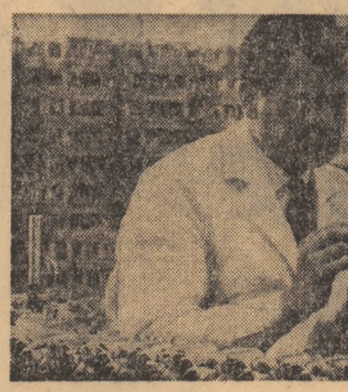
Un ultim control al calității (aspect de lucru la Fabrica de motoare electrice — Pitești)