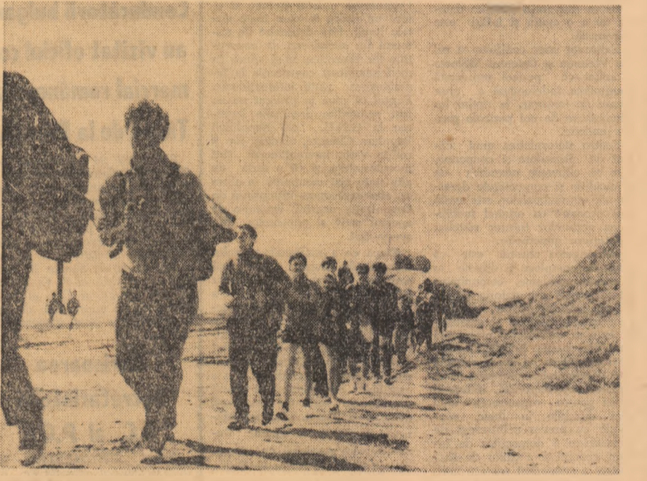
Spre virful Omul