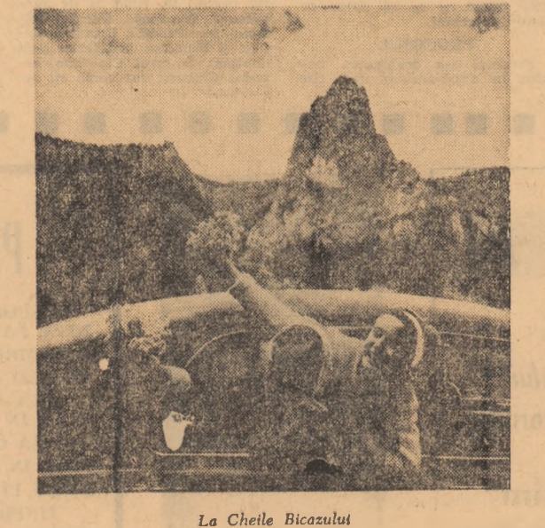
La Cheile Bicazului

PLANETA MAIMUTELOR rulează la Patria (orele 9; 11,30; 14; 16,30; 19; 21,15). FRUMOASELE VACANȚE rulează la Republica (orele 9,30; 11,45; 14; 16,30; 18,45; 21). OPERAȚIUNEA SAN GENARU rulează la Festival (orele 8,30; 11; 13,30; 16; 18,30; 21). Feroviar (orele 9—15,45 în continuare 18,15; 20,45); Modern (orele 9,30; 11,45; 14; 16,15; 18,20; 20,45). ROATA VIETII rulează la Sala Cinemateca (orele 9,45; 12; 14,15; 16,30; 18,45; 21). MARYSIA ȘI NAPOLEON rulează la Lucașfăur (orele 8,15; 10,45; 13; 15,45; 18,15; 20,45). WINNETOU rulează la Victoria (orele 9; 11,15; 13,45; 16,15; 18,30; 20,45); Grivița (orele 9; 11,30; 13,30; 16; 18,15; 20,30); Auro-căuș (orele 9; 11,15; 13,30; 15,45; 18; 20,30). NEÎNTELESUL rulează la Flamura (orele 9; 16; 18,15; 20,30). PRINȚESA