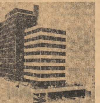
Aici a fost instalat și ca funcționează „creierul” conducerii și desfășurării jocurilor olimpice din Mexic