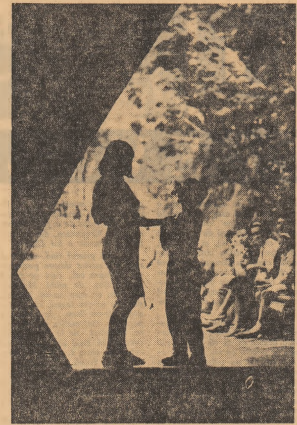
Cură de ape la Olănești

„Ca urmare a publicării articolului „Două sincere regrete”, în care e vorba despre defecțiunile de execuție polițistică a lucrării „Arșiță”, vă informăm că am trimis cititorului un exemplar bun.