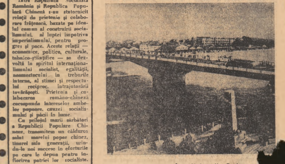
R. P. CHINEZĂ. — Vedere din Canton

Se împlinește 10 ani de la proclamarea Republicii Populare Chineze, eveniment de o deosebită importanță la epoci contemporane, care a deschis o eră nouă în mult milenara istoria a Chinei. Victoria revoluției populare a deschis energiile marelui popor chinez, care, sub conducerea Partidului Comunist, a început construcția unei vieți noi, înălțîndu-și profesorii revoluționari în toate sectoarele. Succesul poporului chinez sînt remarcabile atât în industrie, cât și în agricultură, în dezvoltarea științei, ca și a tehnicii. Poporul român se bucură din toată inima de aceste realizări care întăresc forța sistemului mondial socialist. Într-o Republică Socialistă România și Republica Populară Chineză s-au stabilit relații de prietenie și colaborare frățioasă, bazate pe idealul comun al construirii socialismului, al luptei împotriva imperialismului, pentru progres și pace. Aceste relații — economice, politice, culturale, tehnico-științifice — se dezvoltă în spiritul internaționalismului socialist, egalității, înțelegerii, înțelegerii interne, al simțului și respectului reciproc, intrajutorării tovarășești. Prietenia și colaborarea româno-chineză corespunde intereselor ambelor popoare, cauzei socialiste și păcii în lume. Cu prilejul marii sărbători a Republicii Populare Chineze, transmitem un cald urăz salut marelui popor chinez, tinerei sale generații, urîndu-și noi succese în eforturile pe care le depun pentru înflorirea patriei lor socialiste.