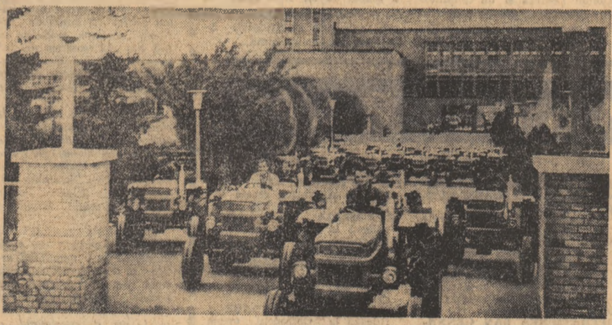
Noile tractoare „U-400” teînd pe poarta uzinelor „Tractorul”-Brașov