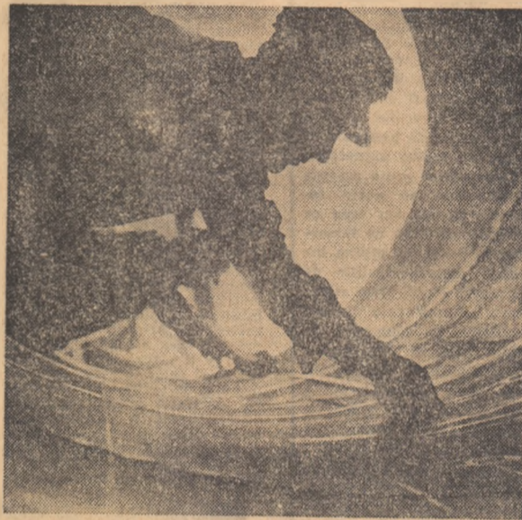
În secția cazangerie a uzinei „Crieția roșie” București