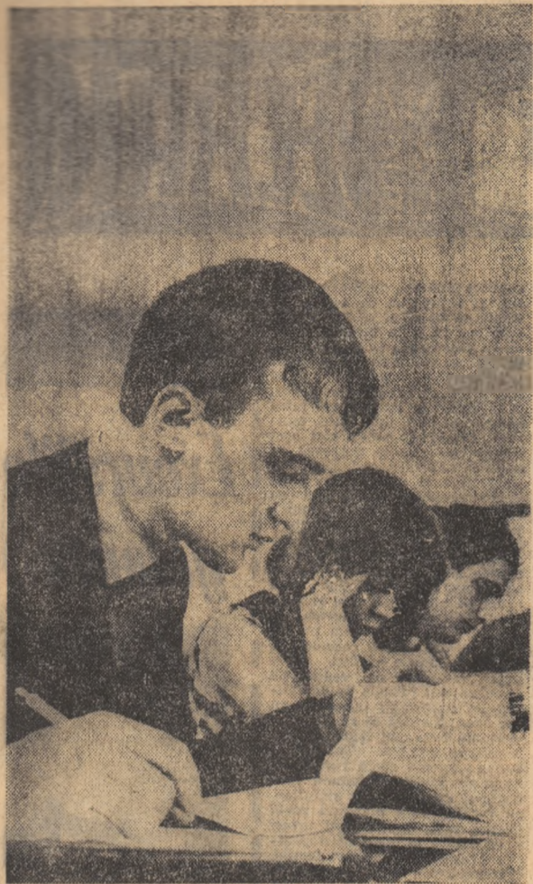
Biblioteca Municipiului Deva SALA DE LECTURĂ

a inaugurat o expoziție de mașini de tricoot ciorapi în cadrul căreia zilnic se organizează pentru specialiști demonstrații practice. • DR. MARIN DUMITRU , de la Centrul de reumatologie din București, a obținut premiul I la ediția 1968 a Concursului internațional de reumatologie organizat de Societatea „Terme” din Salsomaggiore — Italia.