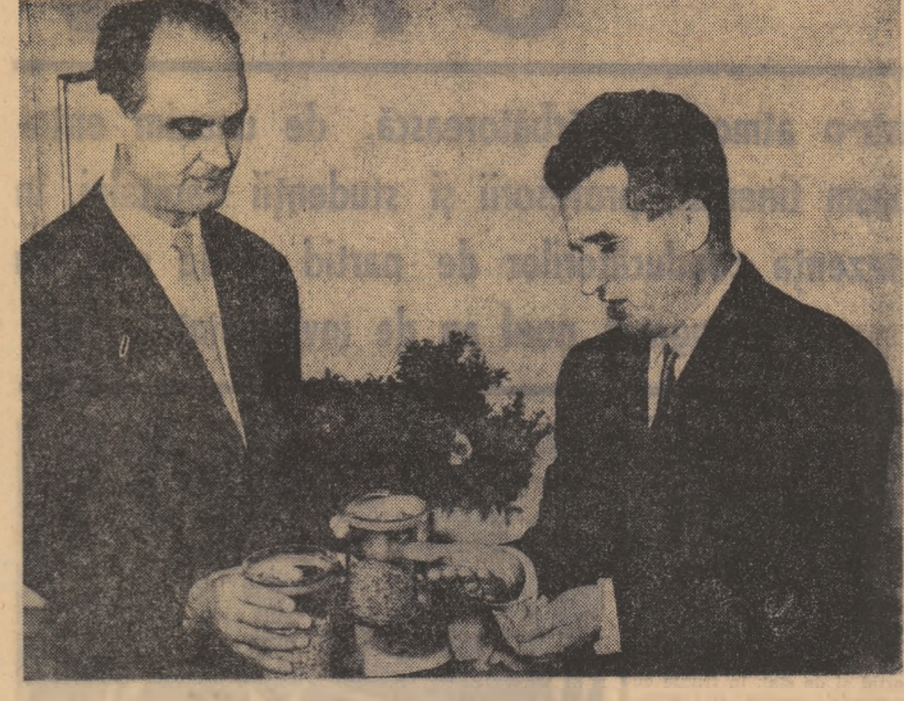
În laboratorul Institutului botanic al Facultății de biologie a Universității bucureștene