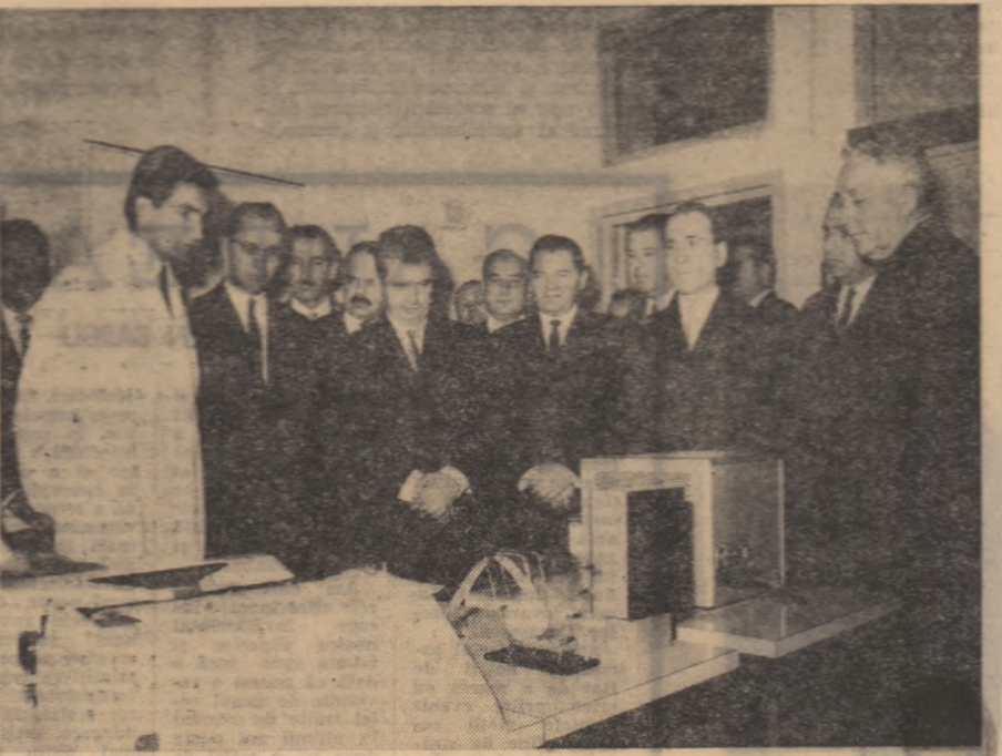
Într-unul din laboratoarele moderne de calcul economic al Academiei de studii economice, conducătorii de partid și de stat primesc explicații privind funcționarea noilor aparate.