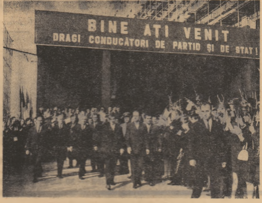
Înălți oaspeți vizitează noul pavilion al Academiei de studii economice

Prezența conducătorilor de partid și de stat în noul sediu al celei mai vechi școli tehnice superioare românești, în această lună cînd se împlinesc 180 de ani de la înființarea învățămîntului tehnic superior în limba română — vine să sublinieze încă o dată atenția și grija permanentă acordată de partid și guvern dezvoltării învățămîntului politehnic, ri-