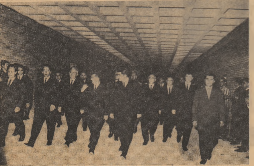
Conducătorii de partid și de stat vizitînd Institutul politehnic din Capitală