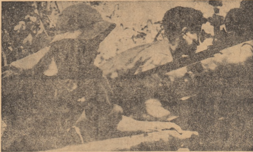
Vietnamul de sud. O subunitate de artilerie a patrioților în acțiune.

în același spirit în abordarea problemelor conviețuirii internaționale, a colaborării reciproce, a avantajelor cu toate țările, indiferent de sistemul lor politic și social. Ca și România, a spus el, Uruguayul acordă o mare importanță dezvoltării comerțului internațional, văzând în el o contribuție la avansul economic și la bunăstarea popoarelor. La convorbire a participat, de asemenea, ambasadorul extraordinar și plenipotențiar al Republicii Socialiste România în Uruguay, Victor Florescu. În aceeași zi, grupele de lucru alcătuite din membri și experți ai delegației au purtat tratative cu reprezentanții ai Comisiei de planificare și buget, Băncii centrale, Camerei de industrie și comerț, Asociației exportatorilor uruguayeni, Intreprinderii de teleoane și electricitate și ai Societății naționale pentru petrol. În cadrul ședințelor s-au examinat modalitățile și mijloacele concrete de intensificare a schimburilor comerciale între România și Uruguay.