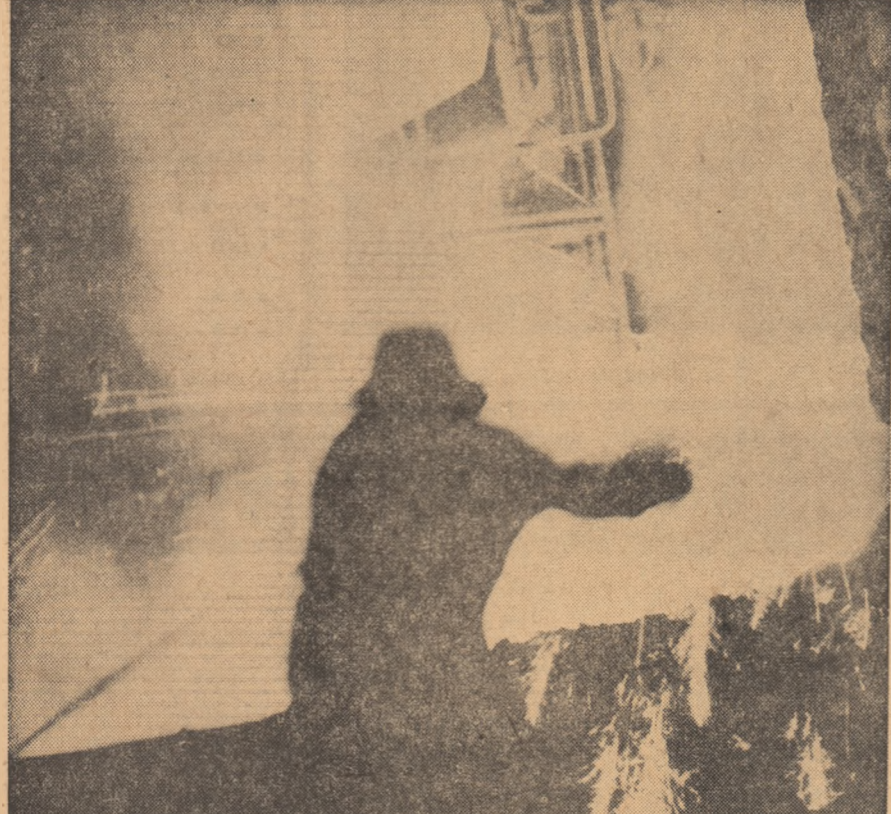
Oamenii Reșiei se călesc în focul nestins al cuptoarelor